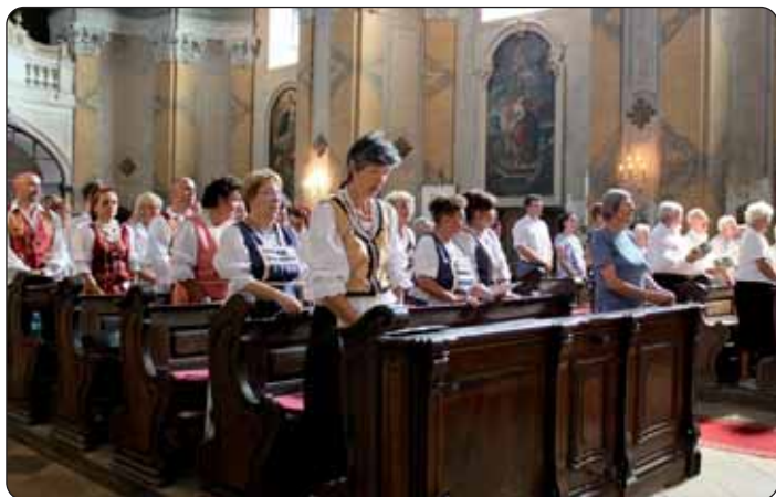
Molitva i pjesma hrvatskih vjernika

U Erčinu se i ove godine, 14. kolovoza, proslavio znameniti blagdan erčinskih Hrvata, hrvatsko proštenje. I ovom su se prigodom okupili erčinski, andzabeški, tukuljski, kalački Hrvati te oni iz drugih krajeva.