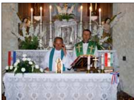
Hrvatski dan u Birjanu