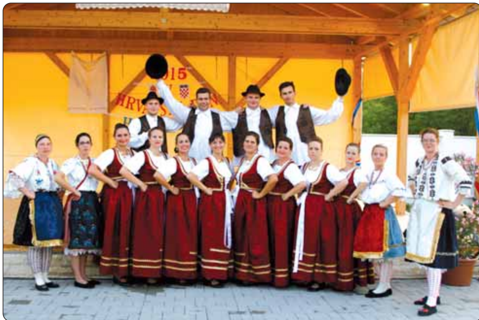
Hrvatska plesna skupina iz Birjana

Dana 18. srpnja, peti put zaredom, uspjeli smo organizirati Hrvatski dan u našem selcu. U ovaj „naš“ dan, kako ga mi, hrvatska zajednica u Birjanu, nazivamo, mnogo truda i rada smo uložili kako bismo našem selu pokazali da se hrvatstvo budi.