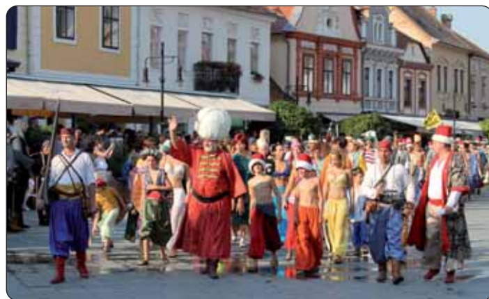
Dolazak Sulejmana i njegovih podanikov

dom veliki vezir tumači zapovid Sulejmanov za predaju, dokle Jurišić odgovara, nij' predaje, pripremi su na krvoprolivanje i smrt, ali ljubljene grad Kisege ne daju. Još jedan napad, još jedna bitka, još jedan poziv na juriš, prošlost se pred našimi očmi odigrava, a u zadnjem ispadu braniteljev pojavi se i lik Sv. Martina. Na ov prizor se spuščaju u bižanje i po legendi Turki i na ov način se spasi grad Kisege, i svi branitelji. Publika zadovoljno aplaudira,