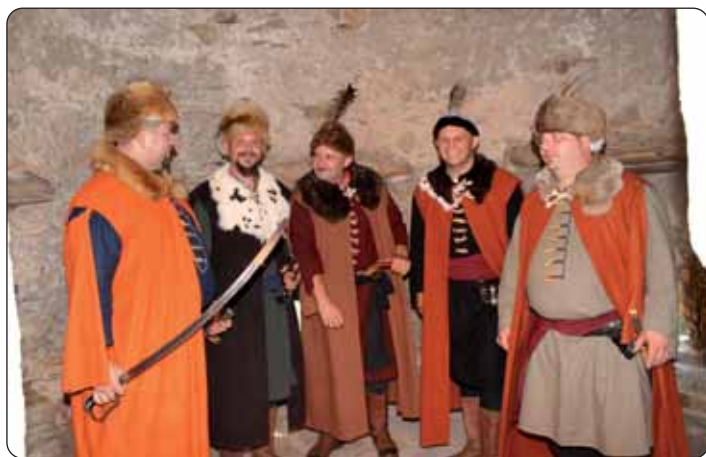
Hrabri pomoćnici u obrani, „Picoki“ iz Đurđevca