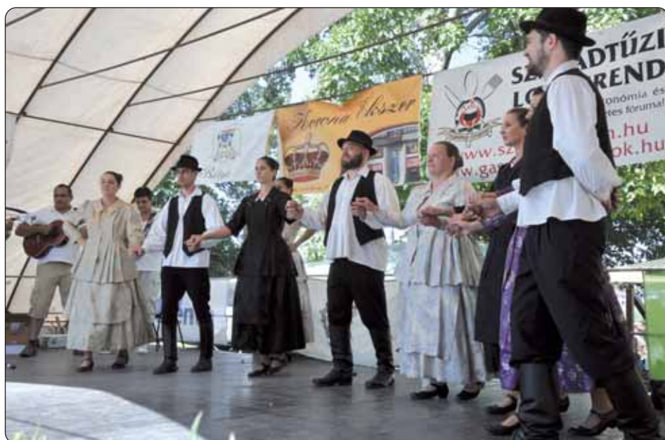
Baćinski HKUD „Vodenica“