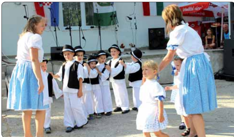
Nastup djece mjesnoga dječjeg vrtića