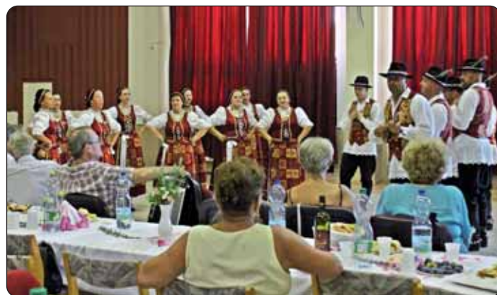
Prate se plesovi skupine „Zorica“.

skome spominju pojedini gradski toponimi: Novi sad (Novi red), Dera, Boston, Krišan Dolina, Kamenica brdo, Bunarina, Ravna i tako redom. Oni su odani njegovatelji starih običaja djedova, ne prođe nijedan blagdan bez tradicijsko postavljenog stola, obreda ili simbola. Na to ih opominju i obiteljska imena poput Bilić, Burlović, Banović, Bulat, Gabelić, Golić, Tokić i tako dalje.