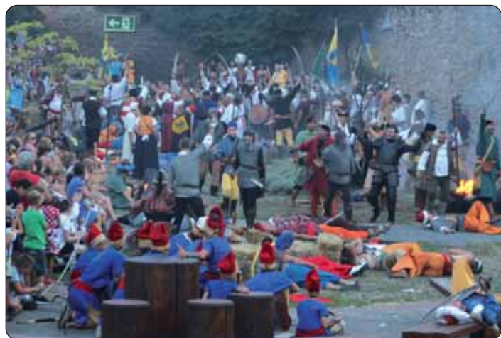
Pobjeda nad neprijateljem