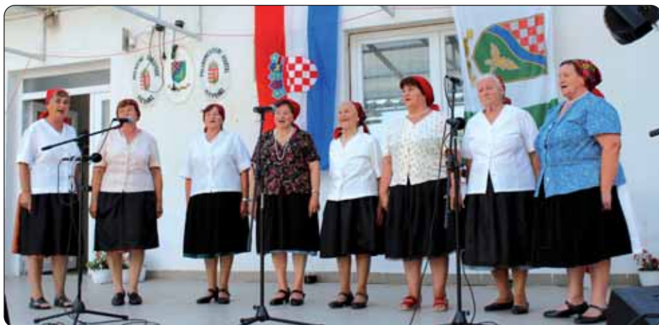
Fičehaski pjevački zbor

SERDAHEL, ZADAR – U okviru suradnje Hrvatske osnovne škole «Katarina Zrinski» i Sveučilišta u Zadru, od 27. srpnja do 3. kolovoza 17 učenika i tri nastavnika serdahelske škole ljetovalo je na Jadranskome moru u Zadru. Serdahelsku družinu primila je dr. Smiljana Zrilić, docent zadarske ustanove. Serdahelski učenici tjedan dana bili su smješteni u studentskome domu, te su za njih bili organizirani izleti na obližnje otoke. Pomurska ustanova ujesen će ugostiti zadarske studente, gdje će obavljati tjedan dana praktičnih vježba.