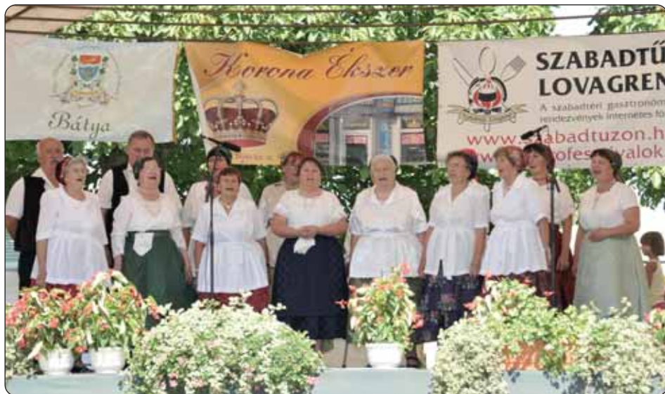
Domaći pjevački zbor „Ružmarin“