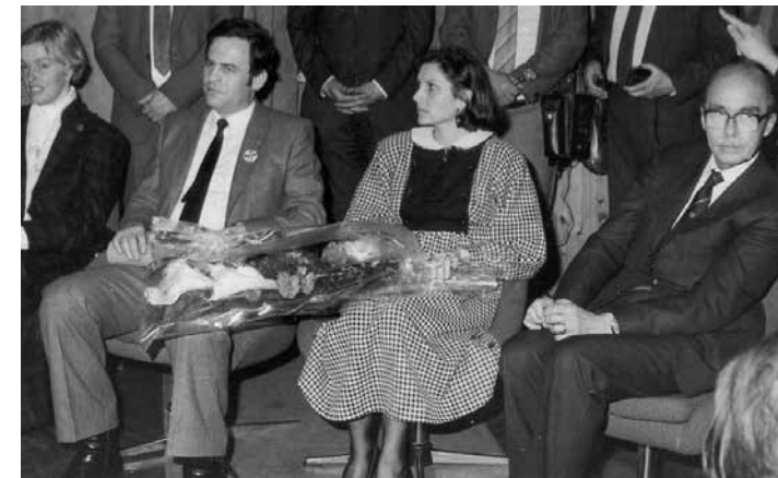
Tökés László és felesége Habsburg Ottó és leánya, Walburga társaságában

tanácselnököt illeti köszönet. Itt került sor Tökés László díszpolgárrá avatására, a következő indokolással: „A város tanácsa Tökés László temesvári református lelkésznek, a népek, nemzetiségek jogaiért kiálló, a kulturális értékek megsemmisítése ellen szavát felemelő bátor közéleti személyiségnek, a humánus, gondolkodó, vallásosságában állhatatos embernek elismerésül a Sárospatak Díszpolgára címet adományozza.” Habsburg Ottó ugyanekkor emlékklevelet kapott, abból a megfontolásból, hogy a Tökés Lászlót köszöntő politikus számára emlékezetessé tegyék az eseményt. A díszoklevél szövegében a tényyszerűsége törekedtünk: „Sárospatak Város Tanácsa tisztelgve személye és azon tevékenysége előtt, mely segítséget nyújt hazánk és Európa egymásra találásához, Dr. Habsburg Ottó úrnak, az Európai Parlament alelnökének kitüntetett díszoklevelet adományoz. Ez az oklevél a Sárospataki Diákegylet meghívására városunkban tett látogatása emlékére készült, egyedi és visszavonhatatlan.”