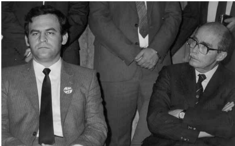
Tökés László és Habsburg Ottó az ünnepi városi tanácsülésen

Habsburg Ottó előadása – amely egyszerre volt történelmi visszatekintés és modernizációs program – mély benyomást tett a hallgatóságra. Okfejtése világos, történelmi példái helytállóak és szemléletesek voltak. Általában az volt a benyomásunk, hogy látogatását nem „haknának” tekintette. Tisztelte a közönséget. Bejelentette, hogy állva kíván szólni, s azért olvassa fel előadását, mert nem szeretné, ha a beszédét bárki improvizációnak tartaná. Különösen jó néven vették, hogy hagyott időt kérdésekre, amelyekre komolyan figyelt és kimerítően válaszolt. S minthogy a magyar nyelvet tökéletesen beszélte, kommunikációs zavar nem fordult elő.