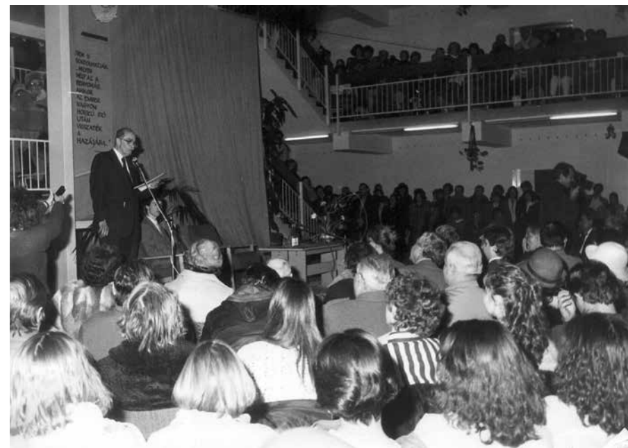
A közönség Habsburg Ottó előadását hallgatja

Erre példa az a sok nehézség, amelyet ma bizonyos államok tapasztalnak a természet védelmében. Mi azt várjuk az államtól, és jogosan, hogy védje a természetet. Na, mármost, a természetvédelem minden esetben sokba kerül, úgyhogy az, aki a természetet szennyezi, nem fogja lelkesen támogatni mindazt, amit a természet érdekében az emberek tenni kényeszerülnek. Az úgynevezett kapitalista államok helyzete előnyösebb, mert az állami és a magánvagyon külön kézben van. Ennek folytán a kormányok, ha jóakaratók, adminisztrációjuk révén lépéseket tehetnek a természet védelmére. Az ún. szocialista államokban ezzel szemben az egész vagyon az állam kezében van. Mármost az állam csak egy teoretikus képződmény. Az az állítás, hogy az állam kezében lévő vagyon a közösségé, egyszerűen nem felel meg a valóságnak. Államosítás a legtöbb esetben csak azt jelenti, hogy a bürokrácia átvette a hatalmat a közgazdaságban. Egy kormánynak, még egy jóakarató kormánynak is, szüksége van a bürokráciára, hogy keresztülvigye azokat az elveket, amelyeket a politikában meg akar valósítani. Így tehát a legjobb kormány sem tudja elérni a bürokráciánál, hogy keresztülvigye elveit a természet védelmében, ha a bürokrácia anyagi jólétének alapja a természet romlása. Ebből