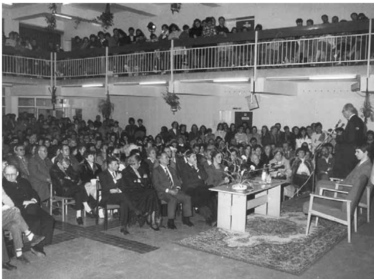
A közönség Habsburg Ottó előadását hallgatja

A Nemzetközi Páneurópai Unió elnökének 1990. február 5-ei sárospataki előadása ma - elhangzása után harminc, az Európai Unióhoz történt csatlakozásunk után tizenhat évvel - elsősorban azért érdekes, mert az élet számos kérdésben igazolta a benne szereplő gondolatokat és feltételezéseket. Habsburg Ottó állam- és társadalomszemlélete ráadásul jelenkori életünk jellemzőivel is számos párhuzamot mutat. Az előadást az alábbiakban közöljük. 15