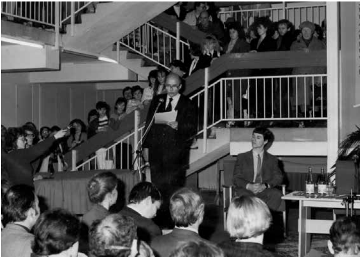
Habsburg Ottó és a Diákegylet elnöke a pódiumon

A mi századunk második felében minden megmozdult. A második világháborút követően egy időre a népek, a sok vérvesztés után, letargiába süllyedtek. Így keletkezhetett az, amit mi ma a jaltai rendszernek nevezhetünk. 25 Ehhez még az is hozzájárult, hogy az atomfegyverek létezése meghiúsított minden tervet, hogy a helyzeten erőszakkal változtassanak. A háborús rizikó olyan mértékben növekedett, hogy még egy lelkiismeretlen zsarnok sem mert volna háborút elindítani, amely végül nukleáris tűzvészbe torkolhatott volna. Háború – és ezekből sok volt – amit még viselni lehetett, kis államok között tört ki, ahol ez a veszély nem állt fenn. Tehát nem annyira a jaltai rendszer jelentett egyensúlyt, mint inkább az a tény, hogy a világ megbénult. Békés egyensúly csak akkor létezik, ha a népek szabadon hozzájárultak a rendezéshez. Ez Jalta után nem történt meg.