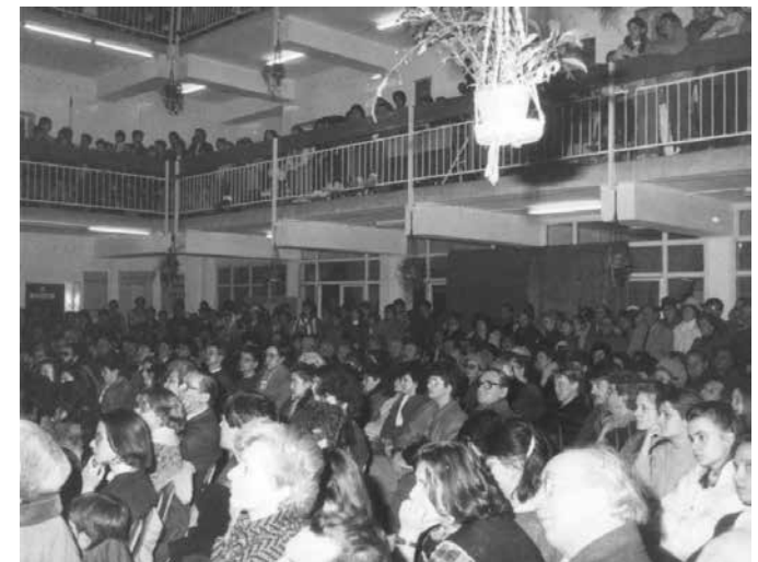
A közönség Habsburg Ottó előadását hallgatja

A szocializmus, főleg doktriner formájában, nem tudott alkalmazkodni az adottságokhoz, mivel egyik alapelve, hogy ő az emberi haladás végleges formája. Ez mindent megbénít és nem engedte, hogy az adottságokhoz alkalmazkodjék, amikor változásokra volt szükség. Ez magyarázza a szocialista rendszer nagy nehézségeit és problémáit, és oka annak, hogy nap-nap után nagyobb a különbség a szabad piaci országok és a szocialista országok között.