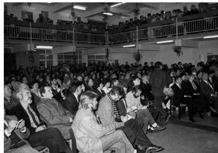
A közönség Habsburg Ottó előadását hallgatja

A most kezdődő évben a felszabadult népek képviselőiket választják meg. 22 Sok fog függeni választóink döntésétől. Nagy tehát a felelősségük. Ezért mindenkinek gyakorolnia kell választói jogát. Aki nem szavaz, segíti azokat az erőket, amelyeket legkevésbé akar, gyengíti a demokráciát és nem teljesíti állampolgári kötelességét.