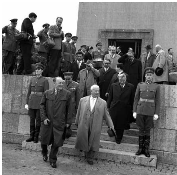
Nyikita Hruscsov, Kádár János és más politikusok 1964. április 4-én, Budapesten, a felvonulási dísztribünről távozóban. A lépcső tetején Fehér Lajos hátrasimítja a haját.

18 Az MSZMP központi vezető szervei üléseinek napirendi jegyzékei, III. kötet 1971–1980. Összeállította: Németh Jánosné. Magyar Országos Levéltár, Budapest, 2000. 27–28. o.