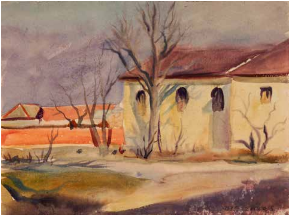
Sárospatak, a Trinitárius kolostor

A fenti előterjesztés Sárospatak szempontjából legfontosabb üzenete az, hogy 1965-ben még nem szerepelt a kormány által rövid távon várossá alakítandó 12 település között, ugyanakkor a szövegből nem derül ki, hogy a hosszú távon fejlesztendő további 14 község között ott volt-e. Másrészt az előterjesztés világossá teszi, hogy időközben a „tizenkettek” többségének várossá alakítása is lekerült a napirendről, amely viszont impliciten arra is engedhetett következtetni, hogy újra megnyílt a pálya mindenki számára.