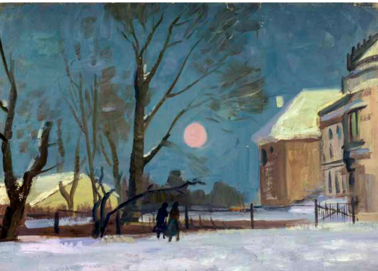
A kastély téli éjszaka