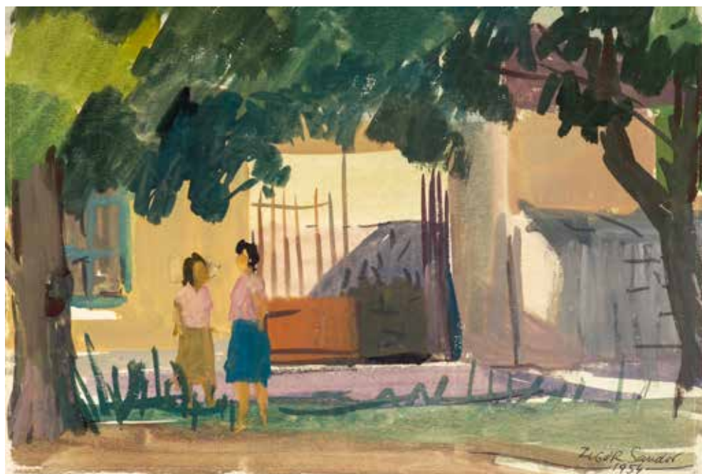
Nyári délután Sárosszéken