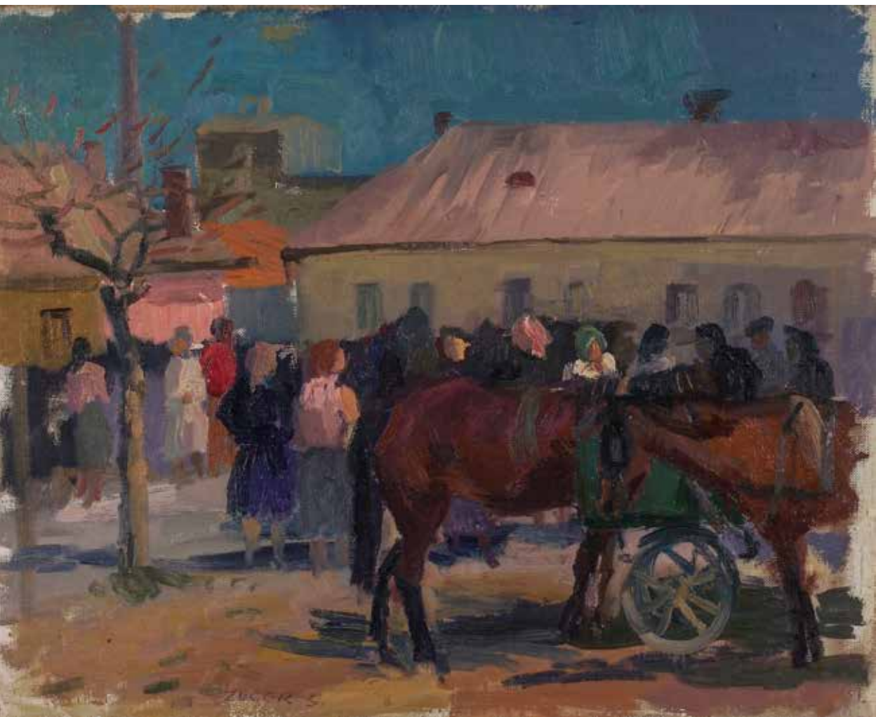
Vásár Sárospatak határában