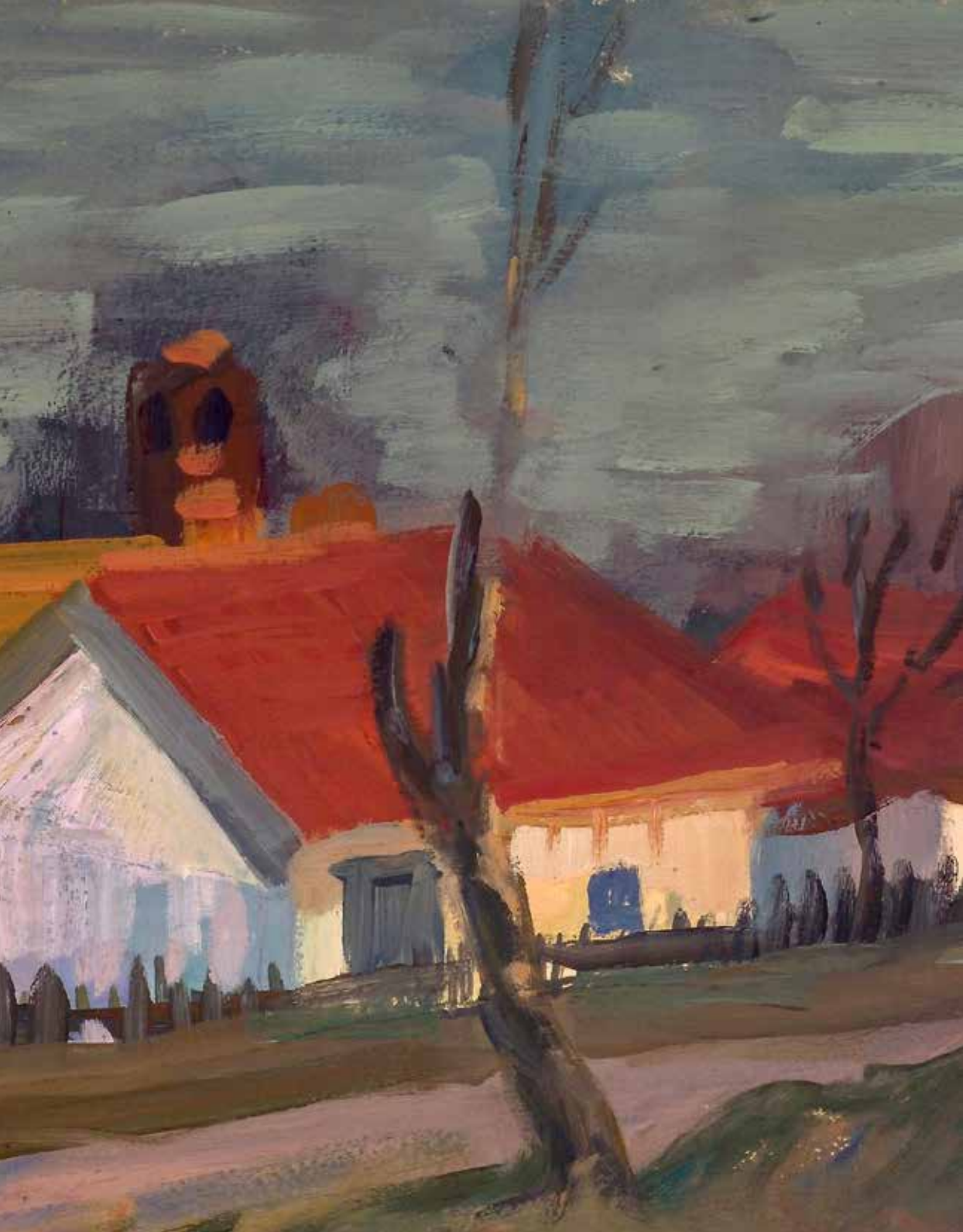
A Bodrog folyó Sárospataknál (részlet)