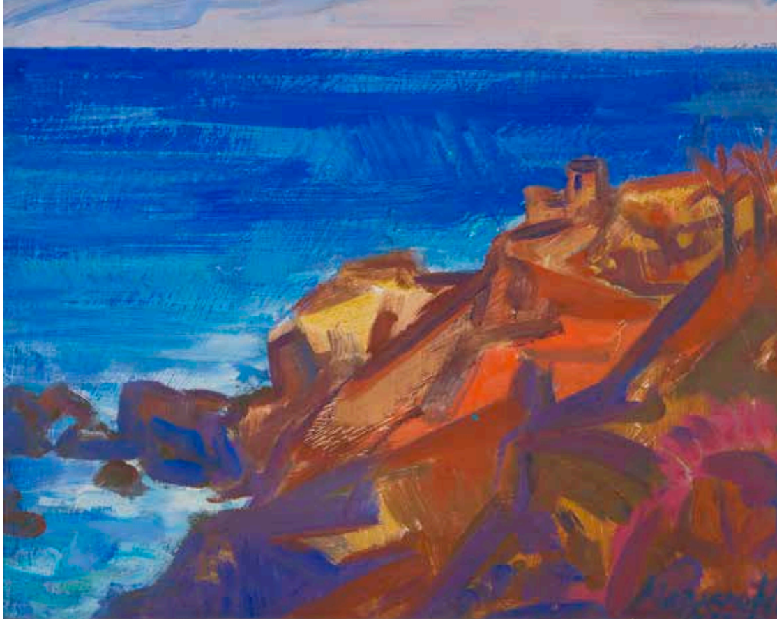
Sziklás part Malagánál