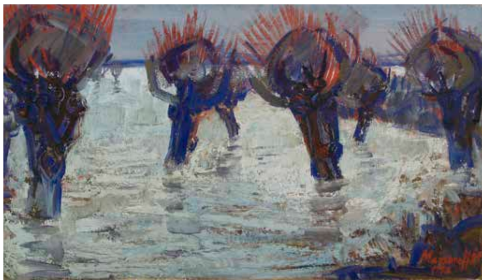
Fűzek a jeges árban