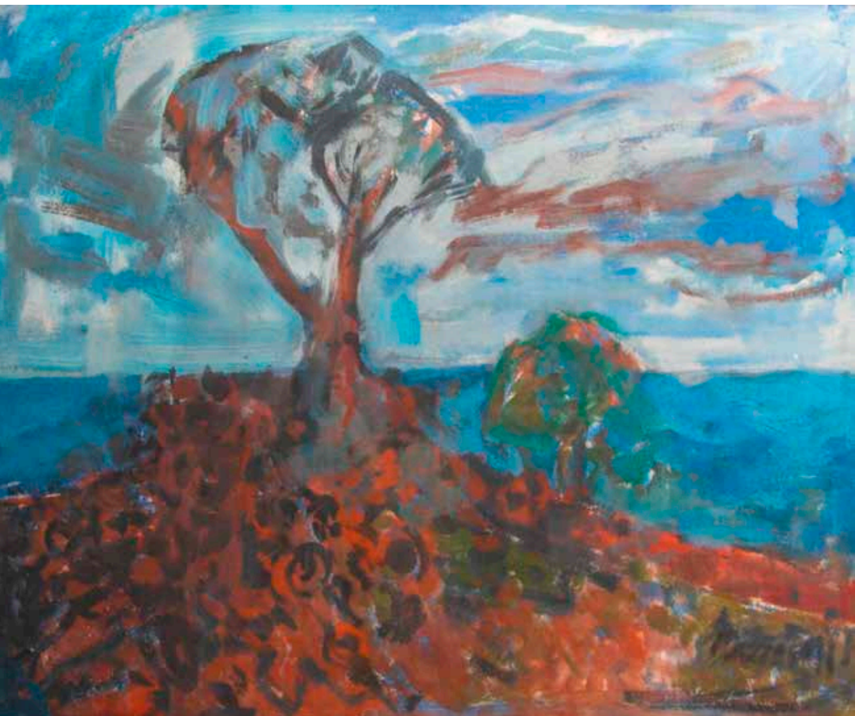
Árva olajfa Olaszországban