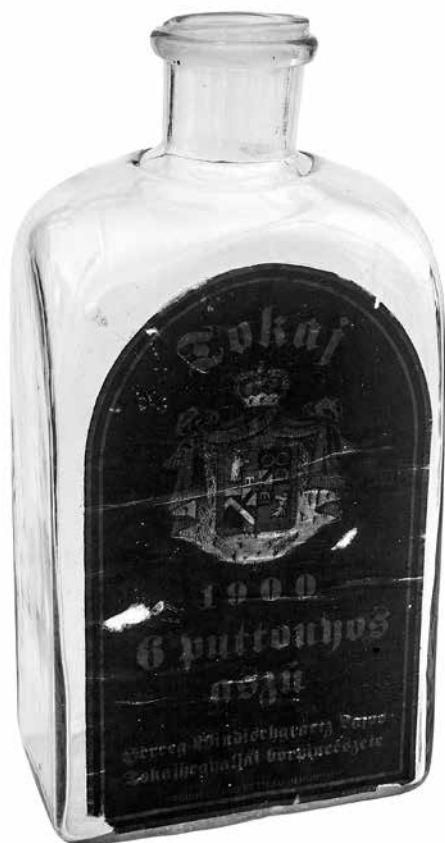
Pincetokba való palack

(Tallián Tibor: Magyar képek. Fejezetek a magyar zeneélet és zeneszerzés történetéből, 1940–1956. Balassi Kiadó – MTA Bölcsészettudományi Kutatóközpont, Budapest, 2014. 460 o. ISBN 978-963-506-941-5)