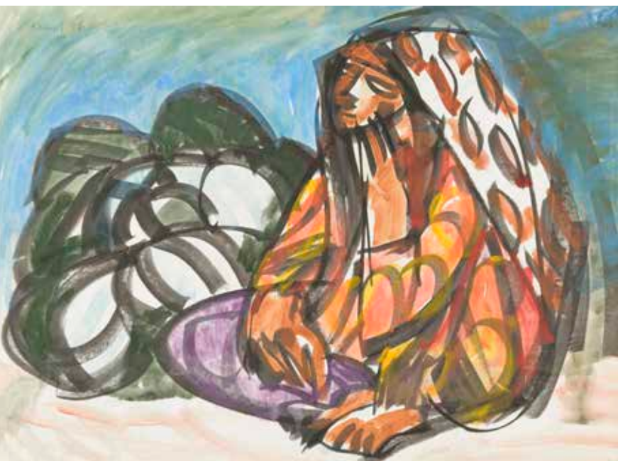
Dinnyeárus türkémén asszony