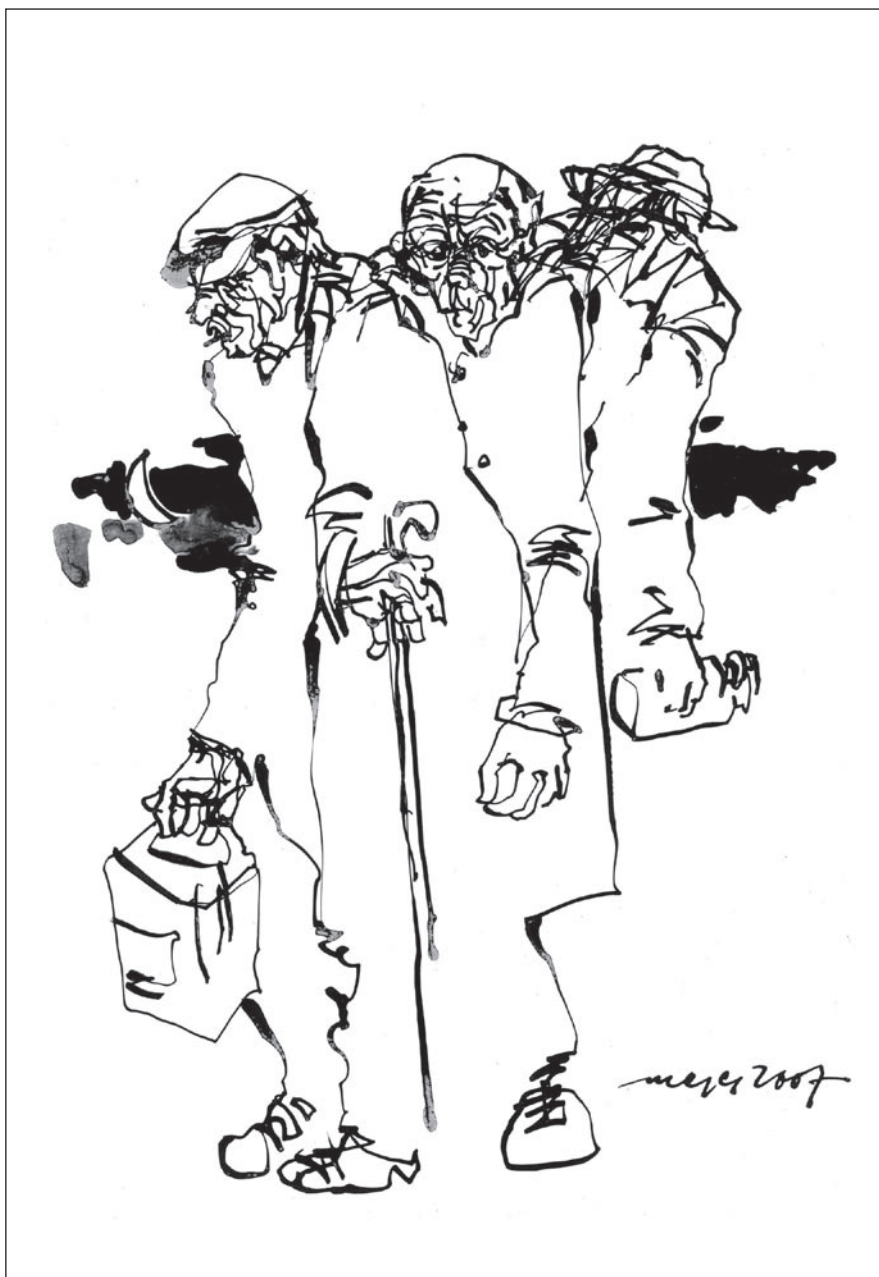
Sors V., 2007