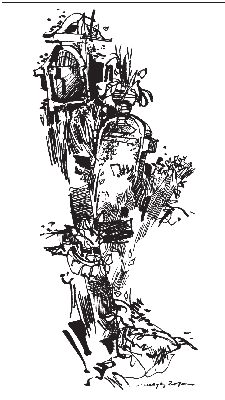
Péteri temető, 2009