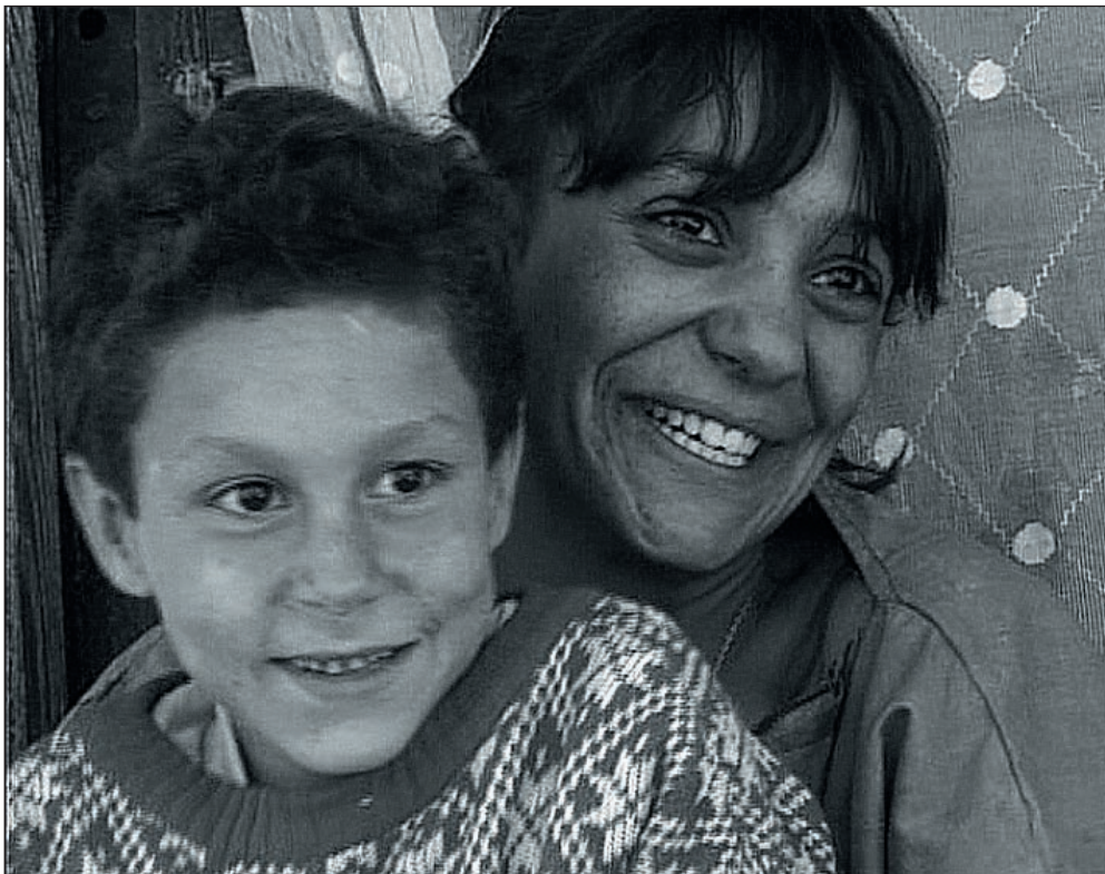
Ahogy az Isten elrendeli... – Olga filmje