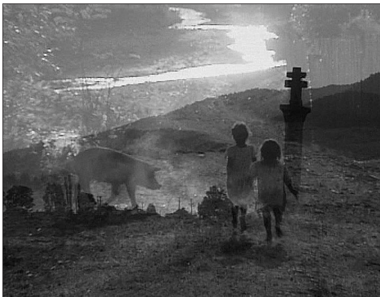
Ahogy az Isten elrendeli... – Olga filmje

Mondd, hát nem csoda az, hogy ott lehetek? Vannak munkatársaim, akikkel oda mehetek. Fajsúlyos, élet érlelte emberek között. A kamera és egy hangmérnök segítségével rögzíthetem is mindazt, ami ott történik, elhangzik. Később, az egyszer megtörtént valóságot újra láthatom. Majd a vágóasztalon olyan szerkezeti-dramaturgiai konstrukciót,