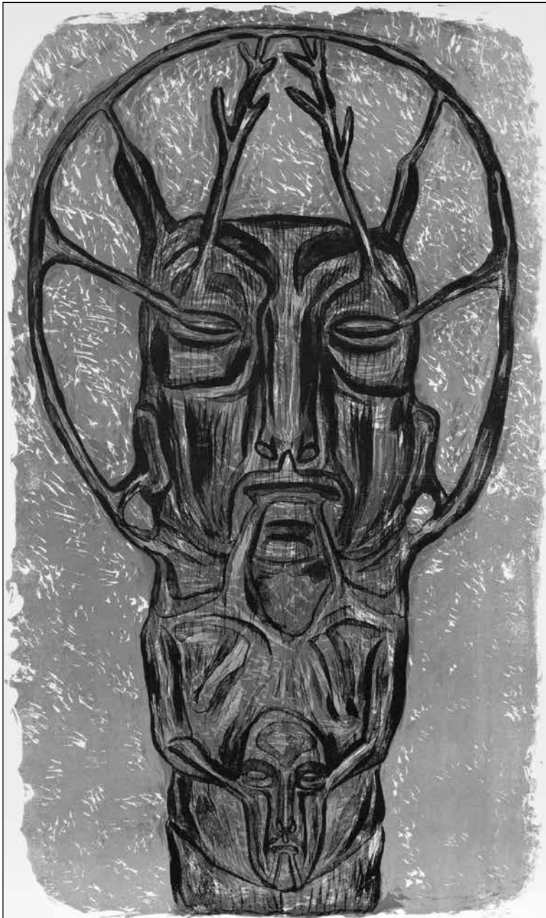
Gaál József: Lapok a „HOMOGRAM” mappából III.