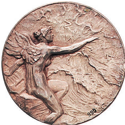
Mayer, Rudolf (1846–1916), 1903, átm. 60 mm, kétoldalas vert ezüstérem