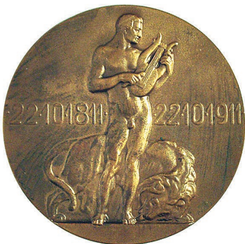
Torff, Emil; 1911; átm. 60 mm, kétoldalas, vert bronzérem