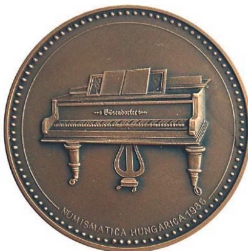
Herwig, Otto, 1986, átm. 38 mm, vert, patinázott bronzérem