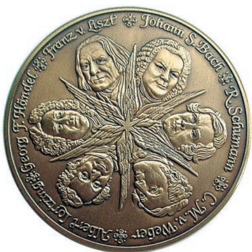
Brunner, Willi Peter, 1985; átm. 50 mm, kétoldalas, vert, patinázott bronzérem