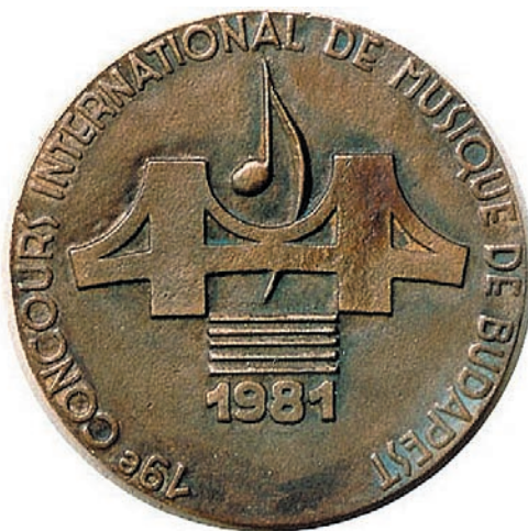
Józsa Bálint, 1981, átm. 100 mm, kétoldalas, öntött bronzérem