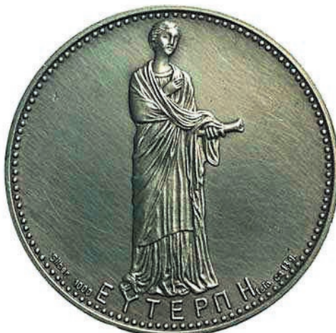
Deutsche Numismatik GmbH., Frankfurt am Main; 1963; átm. 30 mm; kétoldalas, vert ezüstérem