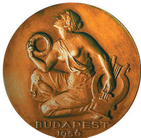
Reményi József (1887–1977); 1956; átm. 90 mm; kétoldalas, öntött bronzérem