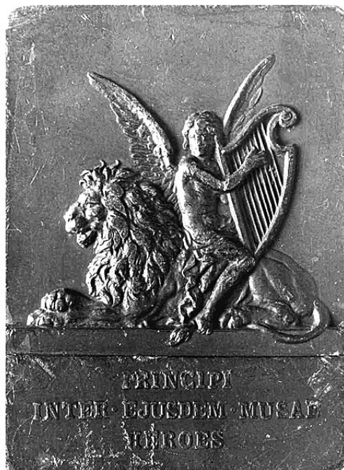
Jauner, Heinrich (1833–1912), 1901; 66x49 mm, kétoldalas, vert ólomplakett