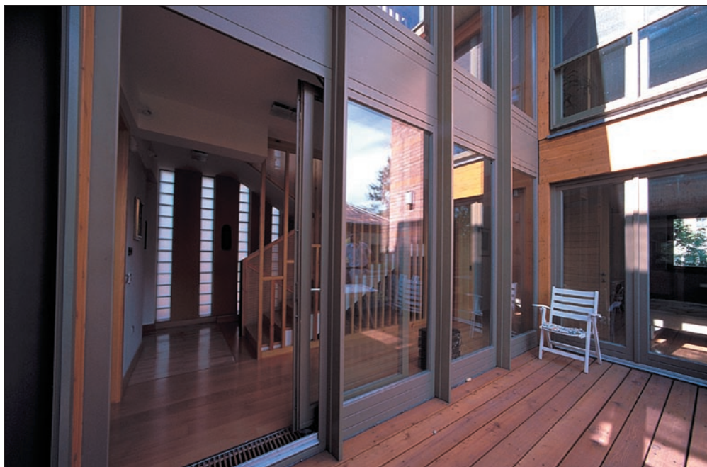
Budapest, XIV. Csernyus u. 28. családi ház