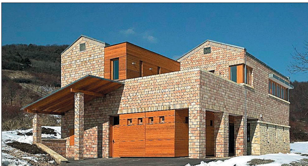
A TÖRLEY Pezsgőpincészet szegi pincészetének fogadó- és kiállító épülete