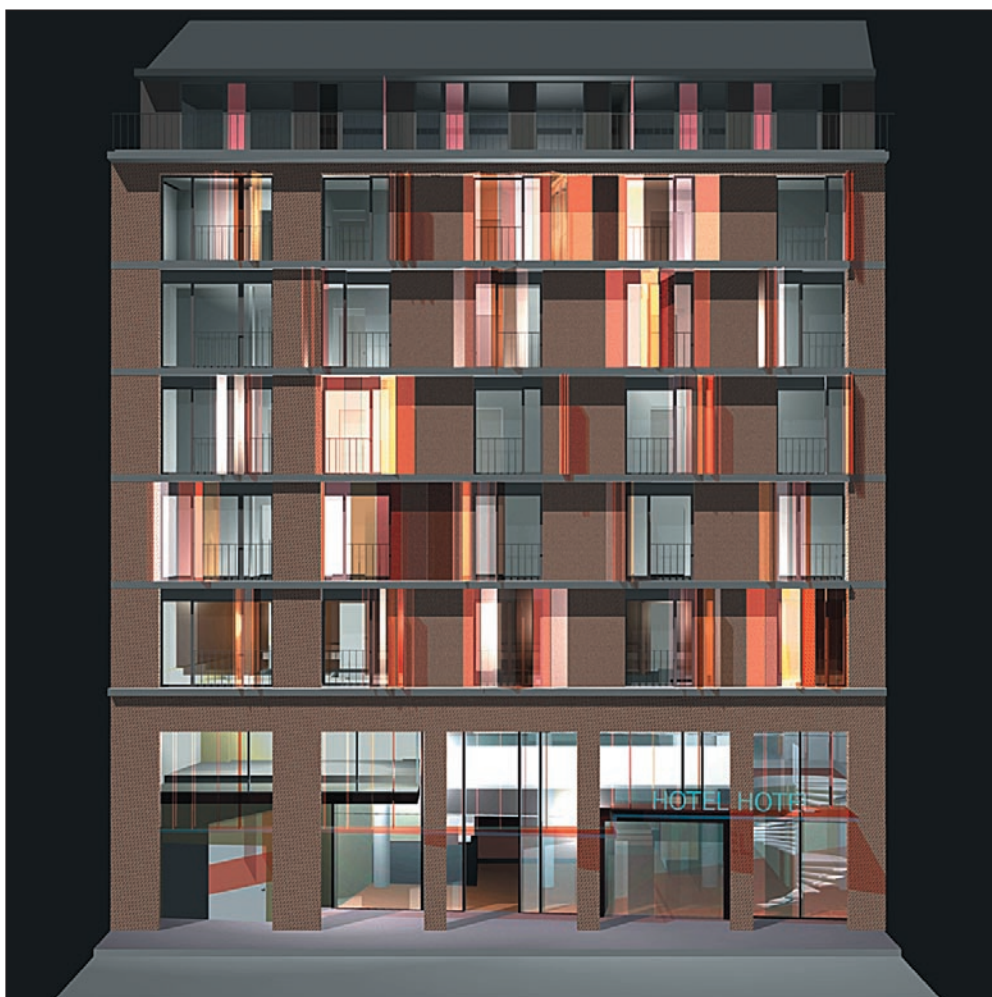
Lánchíd 19 Design Hotel