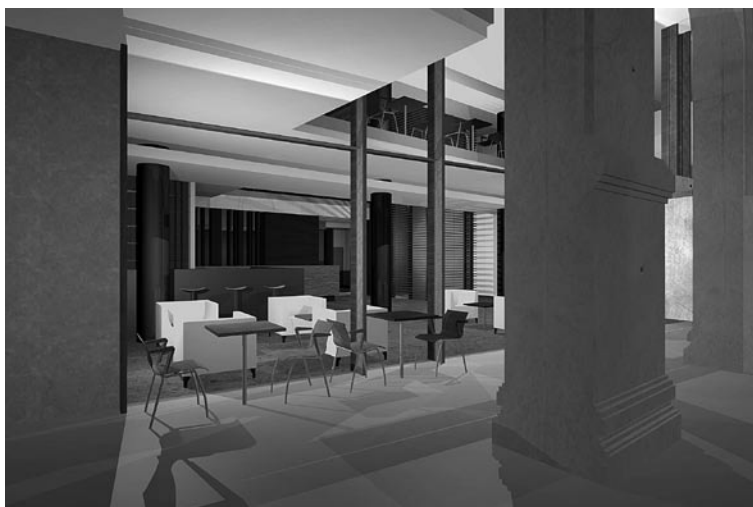
Lánchíd 19 Design Hotel