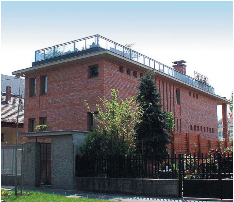
Budapest, XIV. Cseryus u. 28. családi ház