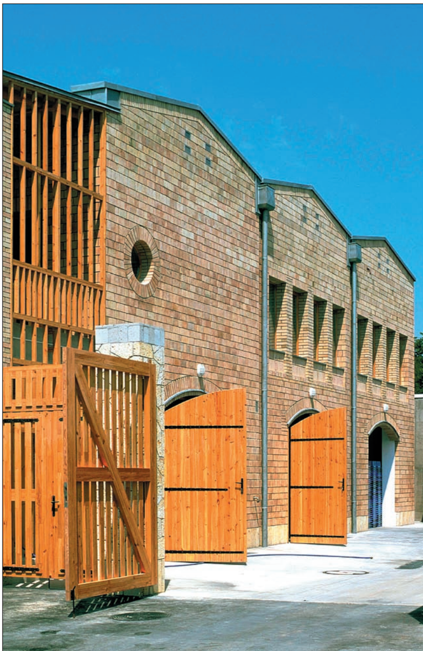
OREMUS szőlő- és borfeldolgozó épület, Tolcsva