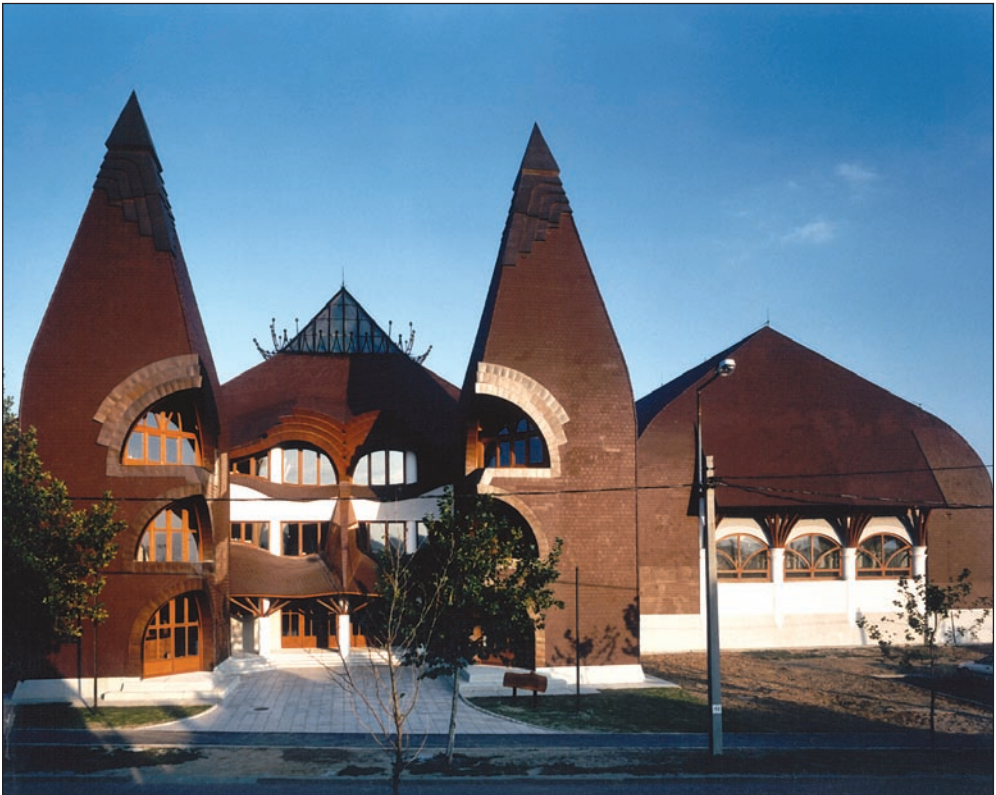
Sárospatak, Árpád Vezér Gimnázium, 1993.