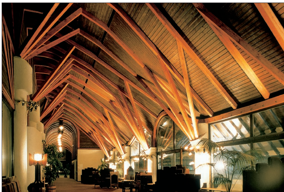
Sáropatak, A Művelődés Háza, 1983.