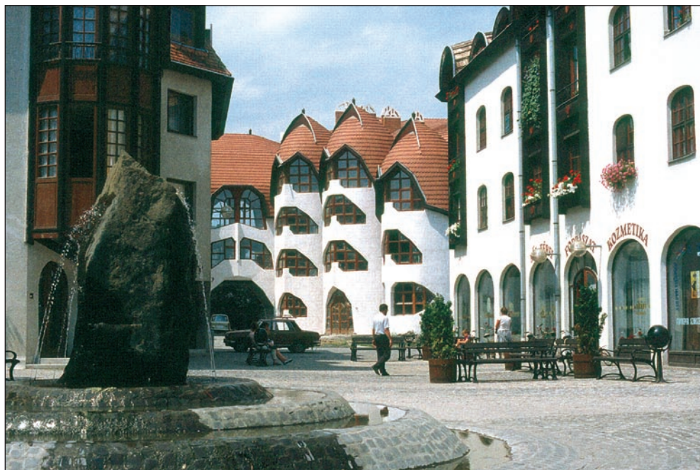
Sárospatak, Hild téri lakóházak, 1980-1988.