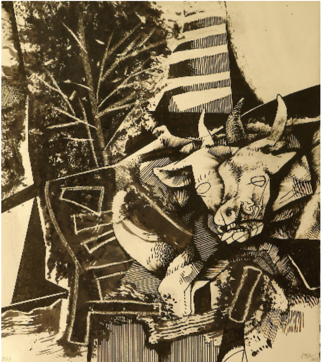
Szólítsd, mint méla borjúszej