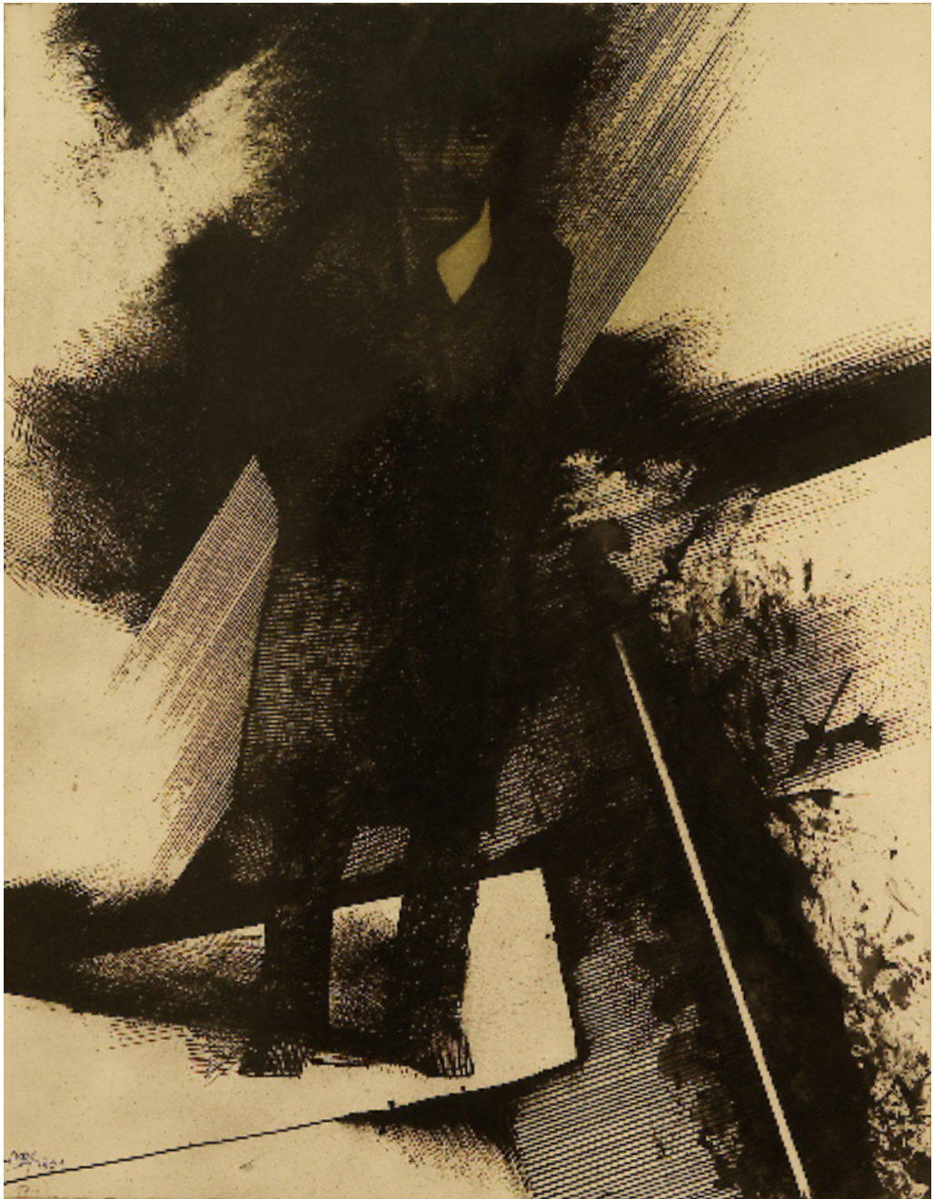
Talán eltűnök hirtelen