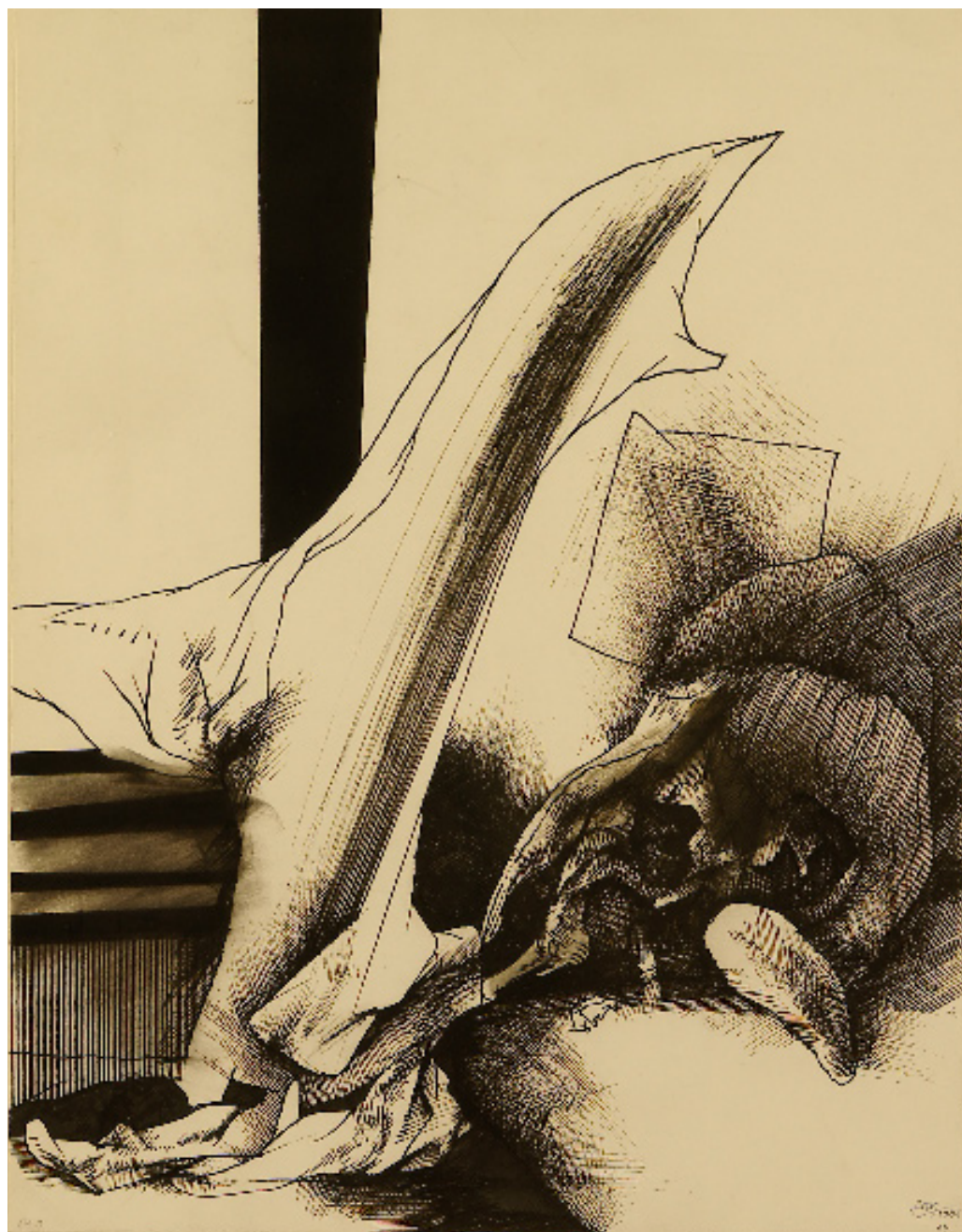
Légy oly ostoba mint majd a halál