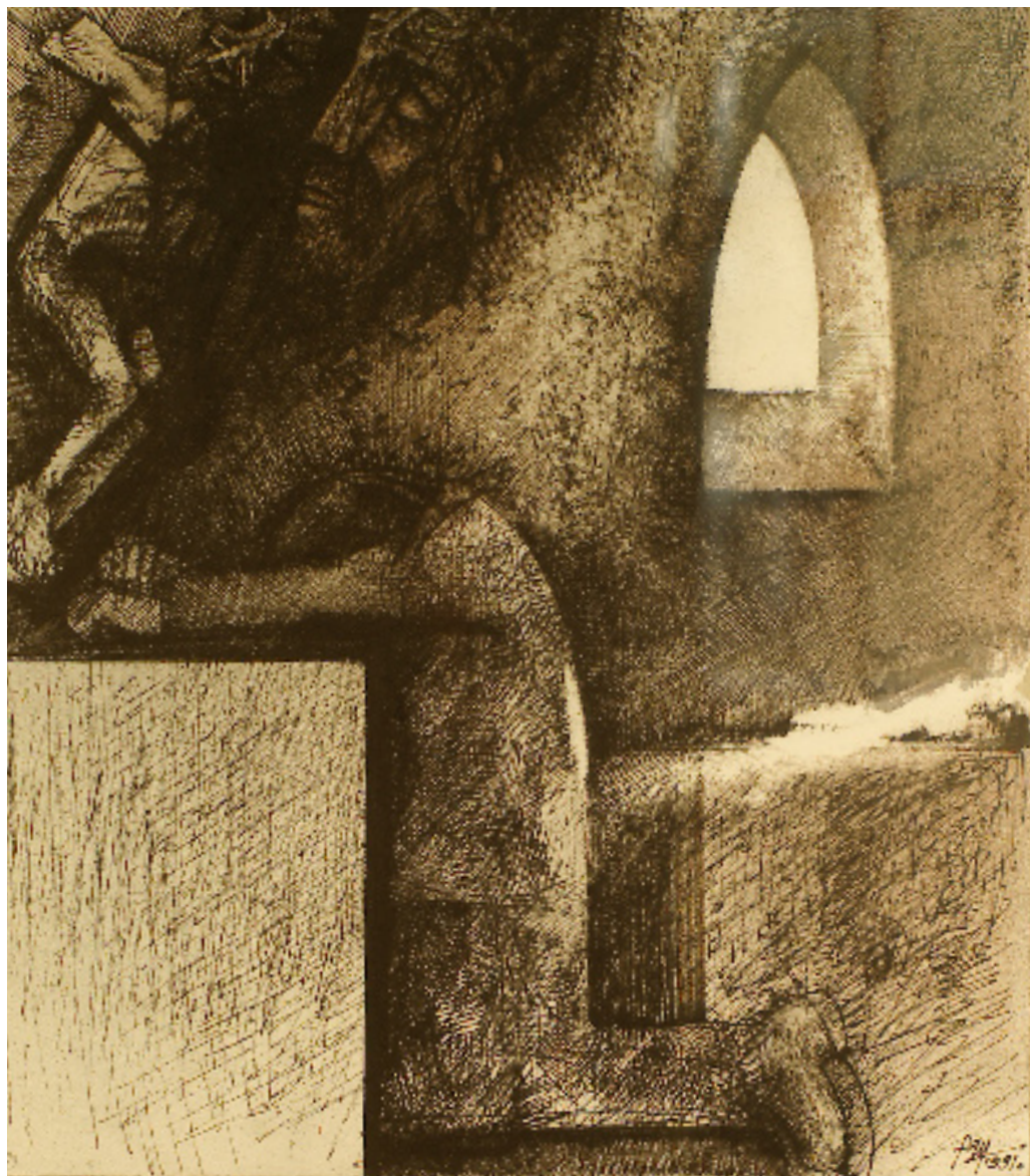
De add kölcsönbe legalább subádat