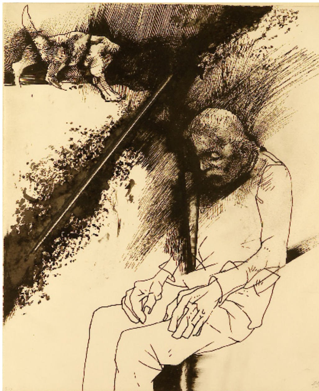
Aki szegény, az a legszegényebb