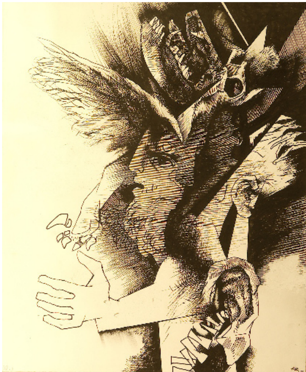
A költő hasztalan vonyít