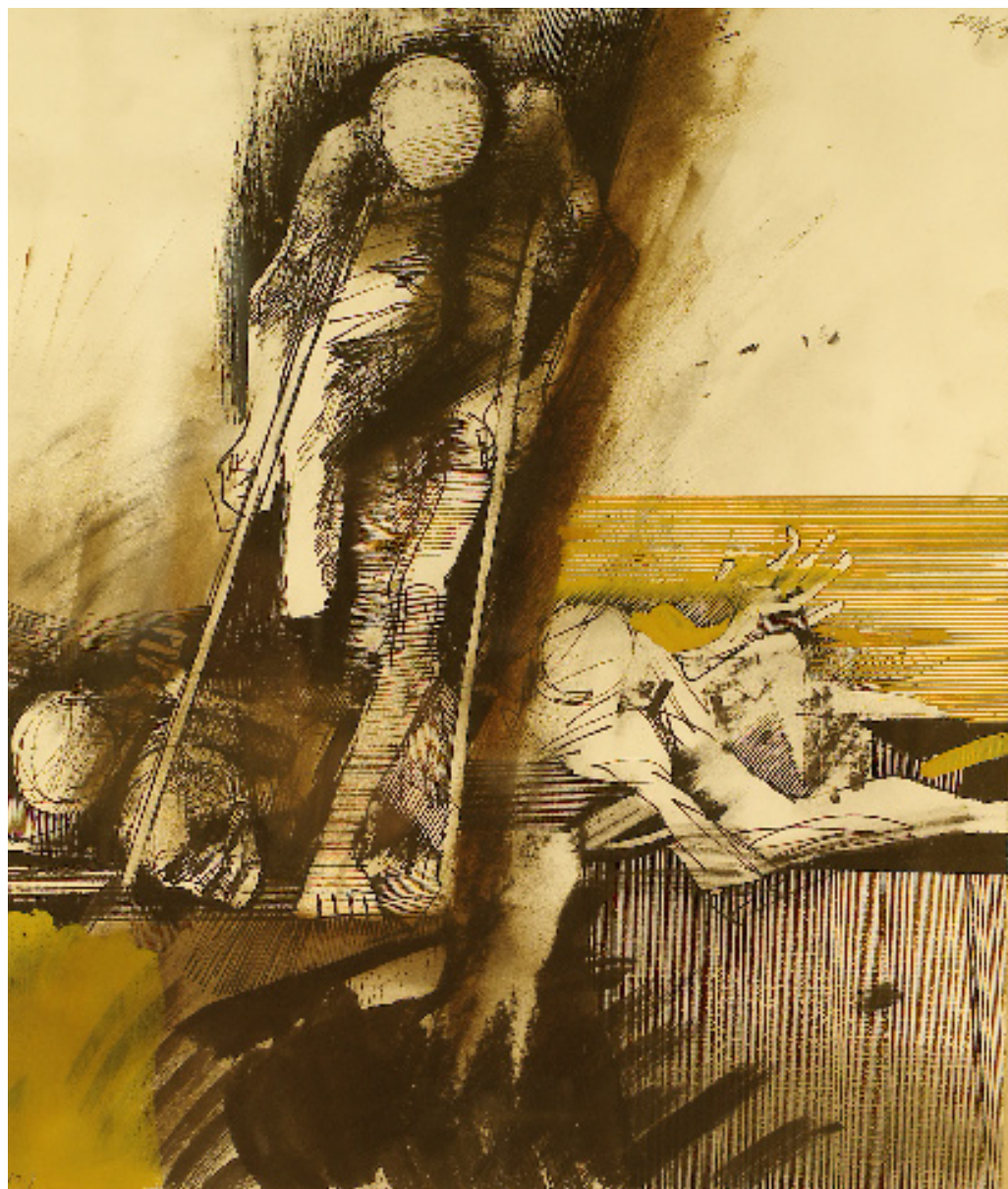
Gyere Úristen, nézd meg itt vagyok