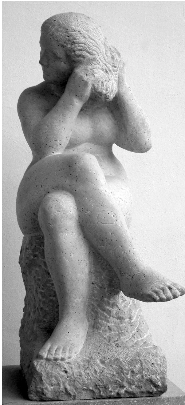
Haját fonó lány