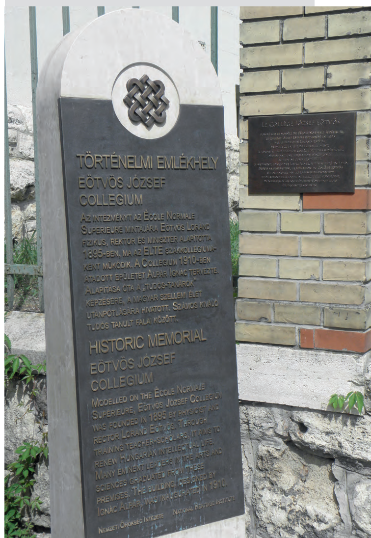
2. ábra. A Collegium történelmi folytonosságát megőrző emlékoszlop

Amit a kérészeltű proletárdiktatúra alatt nem tudtak végbevenni, azt megtették a második világháború után: a Collegiumot, mint rendszeridegen elitista intézményt 1950-ben felszámolták. Szűk egy évtized múlva azonban a tekintélyes akadémikus egykori collegisták és a pártban meghatározó szerephez jutó kommunisták (az úgynevezett kollégista progresszívek) együttműködésével a Ménesi úton létrejöhett az Eötvös József