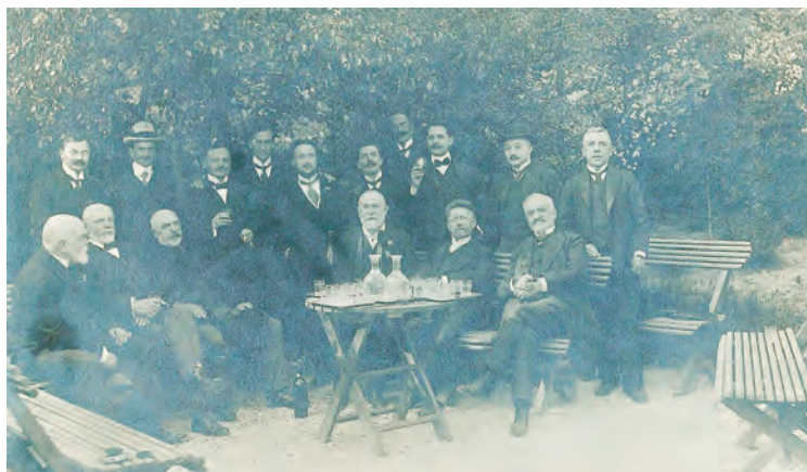
3. ábra. A Collegium tanári kara, 1911

biztosít időről időre. A 2014-ben együttesen történelmi emlékhellyé minősített egykori és mai Collegium mibenlétének, a ménesi úti együttélésnek, a személyes emberi és szakmai fejlődésnek a sava-borsát azonban ma is éppúgy, mint egy évszázada, a különböző szakos hallgatók közös mindennapjai és akár az éjszakákba nyúló eszmecserék adják. A régi szóval „önbeporzásként” jellemzett jelenség ma is működik. A „dögész” (természettudós) és a „filosz” (humán) collegista a szobatársa számára eltérő és olykor meghökkentő gondolkodásmódjával, felvetéseivel állandó mozgásban tartja saját és collegista társa elméjét. A honlapon elérhető, számszerűsíthető eredmények önmagukért beszélnek. Ezek közül itt csupán egy „újkori” tevékenységet lehet kiemelni: az elmúlt évtizedben több mint másfélszáz tudományos és közéleti kiadványt adott ki a Collegium. A közös munka eredményeképpen megjelenő tanulmányok és kötetek rendkívül lelkesítő hatással vannak az elmélyült tanulmányokat és önálló kutatásokat folytató szakkollégisták munkakedvére.