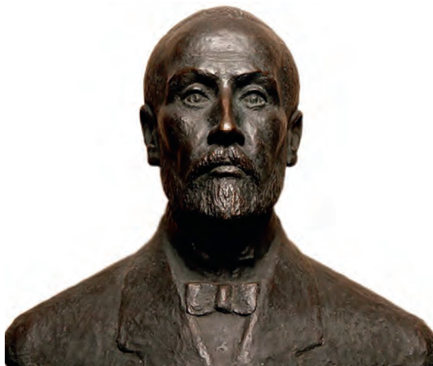
4. ábra. Az ELTE Természettudományi Karának Gömb aulájában látható az egyetem névadójának mellszobra (Csejdy László alkotása)

Egy év múltán, 1872. május 10-én a király az elméleti természettani tanszék nyilvános, rendes tanárává nevezte ki, és két évvel később tagjává vált a tanárvizsgáló bizottságnak is. Ugyancsak 1874-től már kísérleti természettanból is előadást tarthatott, s négy évvel később, Jedlik Ányos nyugdíjba vonulásával, a kísérleti természettan professzora lett, és e tárgy oktatása évtizedeken át az ő gondjaira lett bízva. Az ő tervei és elképzelései szerint épült fel 1883 és 1886 között az egyetem új fizikai intézete az Eszterházy (ma Puskin) utcában.