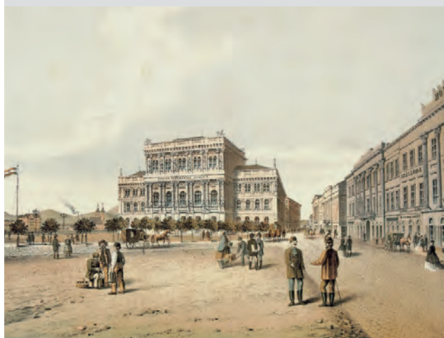
3. ábra. Az Akadémia 19. századi ábrázolása