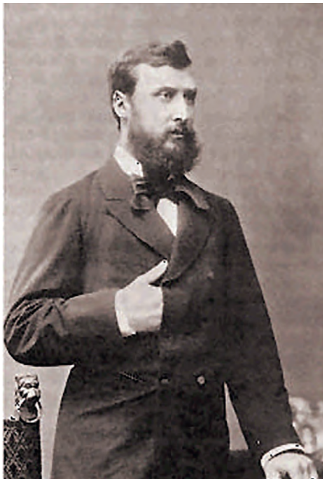
1. ábra. A fiatal Eötvös Loránd

Jól ismert, hogy életének számos területén, például közéleti szerepvállalásaiban vagy politikai nézeteiben édesapja, báró Eötvös József (1813–1871) volt legfőbb példaképe, és meghatározó lehetett számára apja baráti és munkatársi köre is, amelyben ott találjuk a kor legnagyobb politikusait, tudósait, művészeit. Az idősebb Eötvös, kora egyik legjelentősebb politikusa és politikai gondolkodója a Batthyány-kormány vallás- és közoktatási minisztere volt, amikor 1848. július 27-én fia megszületett. Még 1848-ban Eötvös József miniszteri tervei között szerepelt, hogy elfogadtassa azt a reformcsomagot („ A magyar egyetem alapszabályai ”), amely az önálló középiskolai tanárképző intézeteket hozta volna létre a pesti egyetem bölcsészkarja mellett, e terv megszavazására azonban nem kerülhetett sor. Csak jóval később, 1862-ben rendelték el a tanárvizsgáló bizottságok felállítását, de a bölcsészeti kar akkor még nem tudott megfelelni a vizsgálatokra való felkészítés igényeinek. A kiegyezést követően az idősebb Eötvös második minisztersége idején alakult meg a bölcsészeti