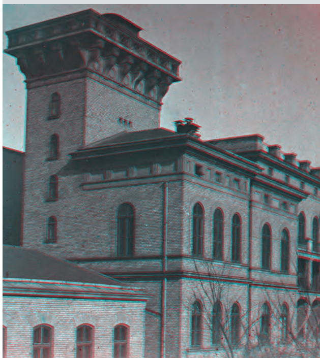
2. ábra. A Magyar Királyi Tudományegyetem 1886-ban felépült D épülete, amelyben Eötvös Loránd kutatott, tanított, és lakott

Az ifjú Eötvös Loránd már középiskolás korában tisztában volt azzal, hogy a természettudományi pályán szeretne érvényesülni. Bár apja kérésére először jogi tanulmányokat folytatott a pesti egyetemen, 1867-ben a németországi Heidelbergbe ment tanulni, ahol 1870 júliusában kiváló eredménnyel megszerezte a bölcsészeti doktorátust természettanból mint fő tárgyból, matematikából és kémiából mint melléktárgyakból. Vizsgái után hazatért, itthon folytatta a korábban megkezdett kutatásait, és már 1870 őszen bekapcsolódott a Természettudományi Társulat munkájába: szerkesztőbizottsági tagja lett a társaság közlönyének, és december elején már be is mutatta egyik dolgozatát kutatási eredményeiről. Egyetemi közegben képzelte el az életét: bő félévvel hazatérte után, 1871. március 5-én benyújtotta kérvényét a Pesti Királyi Egyetemre, hogy egyetemi magántanár lehessen.