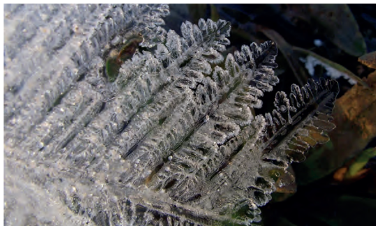
3. ábra. November végén „levelet hozott a posta”, avagy megérkezett a tél fagyos üzenete (A szerző fotója)

mediterrán ciklonokat generált, melyek első példánya 18-án többfelé okozott csapadékot, nyugaton és északon többnyire havazás, másutt vegyesen hó és eső formájában. A Nyugat-Dunántúlon 19-én reggelre síkvidéken is hullott 1-3 cm hó, igaz ez napközben el is olvadt. Ekkor és 20-án már a következő ciklonból esett, és a délkeletről érkező enyhülés hatására egyre többfelé váltott esőbe a csapadék, de nyugaton még 20-án is volt havazás, havas eső. A ciklonok országsszerte 10-15 mm körüli csapadékot eredményeztek. A következő napok többnyire szürke, borongós és párás idővel teltek, éjjel-nappal 5 °C körüli hőmérséklet mellett. 25-én érkezett egy újabb mediterrán ciklon, ami országos esőt és kiadós csapadékot hozott. A legtöbb helyen 20 és 40 mm között alakult a ciklon teljes csapadékösszege, csak a déli országrész maradt el