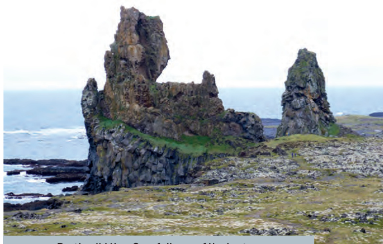
Parti sziklák a Snæfellsnes-félszigeten

A sziget-kerülést kétféleképpen lehet megoldani. Az 1-es számú főúton vagy az óramutató járása szerinti irányba indulva, vagy ellenkezőleg, de teljesen mind-