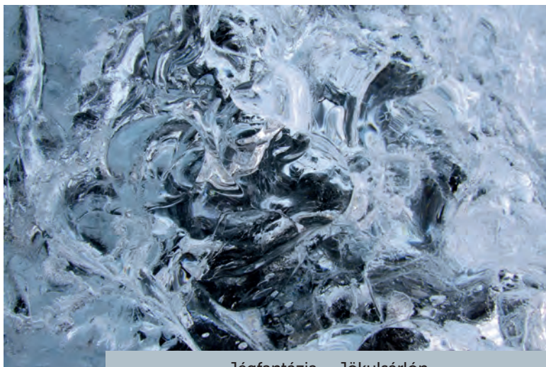
Jégfantázia – Jökulsárlón

Izland nem volna az igazi a gejzírvidék nélkül. Már a terület megközelítésekor sejtjük, hogy nagy buli lesz. 1979-ben, amikor még csak vacak földút vezetett be ide, a