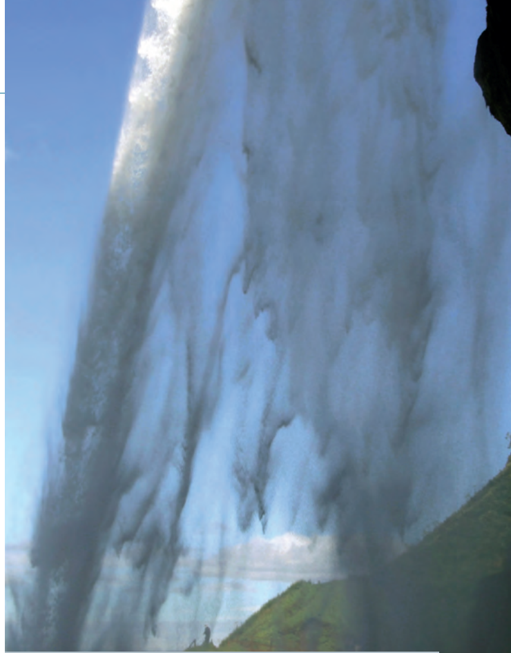
Ezt látni a Seljalandsfoss vízfüggönye mögül

és az olvadékvíz áradatként tör utat, többnyire délnek. Ilyenkor mindet visz – utat, hidat, és persze tömördek törmeléket, amit a parton szépe lerak. Ezt a jelenséget nevezik jökulhlaupnak (kb. gleccserfutás), a létrejött olvadékvíz-síkságot pedig sandurnak (szó szerint homok, pedig dehogyan az). Láttam egy filmet a szintén jég alatti Grímsvötn vulkán 1996-os kitöréséről és következményeiről és megállapítottam, milyen szerencse, hogy az izlandiaknak volt elég eszük lakóhelyileg távol maradni ettől a partszakasztól. Ezt nevezik Skeiðarásandurnak, mely 1300 négyzetkilométeren terül el a Vatnajökull jégmező és a tenger között. És igen, valamivel nyugatabbra láttunk valamennyit a hírhedt Eyjafjallajökullból is, mely 2010-es kitörésével annyi bosszúságot okozott a fél világ légiforgalmának. Az izlandi farmereknek is, hiszen a hamuhullás, mely csak aránylag kis területet érintett, megzavarta a legeltetést. Emberéletben nem esett kár.