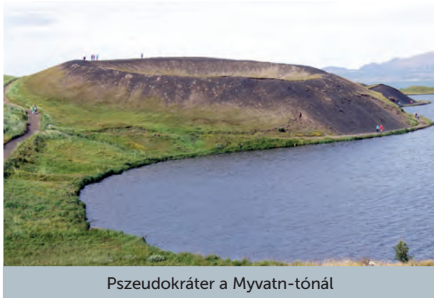
Pszudokráter a Myvatn-tónál

Leghosszabb és a legtöbb látnivalót kínáló napunk következik, végre szép, napsütéses időben. Akureyrir , az ország második legnagyobb városát letudjuk egy szimpla áthajtással, inkább bálnákat szeretnénk látni. Erre a legalkalmasabb hely Húsavík , mely azzal is büszkélkedhet, hogy Izland első viking települése; 850 körül már lakták. Védett kikötőjéből felújított öreg halászhajók viszik a turistákat a nyílt vizekre, ahol nyaranta mintegy 60 eurónak megfelelő izlandi koronáért elvileg 11 bálnafaj egyedeit is megfigyelhetjük, néhányat gyakorlatilag garantáltan. Kettő sikerült: a hosszúsárnyú (más néven púpos) bálnákban mindig lehet bízni, de láttunk egy-két csukabálnát is. Izland egyike ama három nációnak (Norvégia és Japán mellett), mely a nemzetközi tiltás ellenére még mindig gyakorolja a bálnavadászat mesterségét. A hús zömét Japánba exportálják, a maradékot megetetik a turistákkal, hadd próbáljanak ki egy kis különlegességet. Izlandon egyébként, bár a halászat (és a kapcsolódó ágazatok) egyre kisebb szerepet tölt be a gazdaságban (de még mindig a GDP 27 százalékát adja), szinte minden családnak van valami köze a halhoz. Vagy úgy, hogy valamelyik családtag dolgozik hajón vagy feldolgozóüzemben, vagy úgy, hogy az ap-