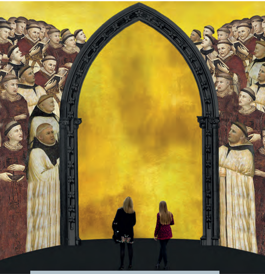
Az európai zenetörténet vívmánya: a vokális többszólamú zene élménye

történetben játszott súlyosabb szerepet, Kodály a zene pozitív társadalmi hatásainak és megfelelő oktatásának létrehozásában. Kodály individuális művészetével is zenei, pedagógiai mozgalmak jelentős vezére volt, Bartók a belső hangra figyelve hozott létre a paraszti közösség és a természet népi élményeiből csak rá jellemző, egyéni, a legnagyobbakhoz mérhető művészetet. Kodálnál őrütek gyúlnak, Bartóknál messzire fénylő világító torony magasodik. Ezt a képet kívánjuk felidézni abban az élménykörben, amely Bartókhoz és Kodályhoz viszi közelebb a kiállítás látogatóit.