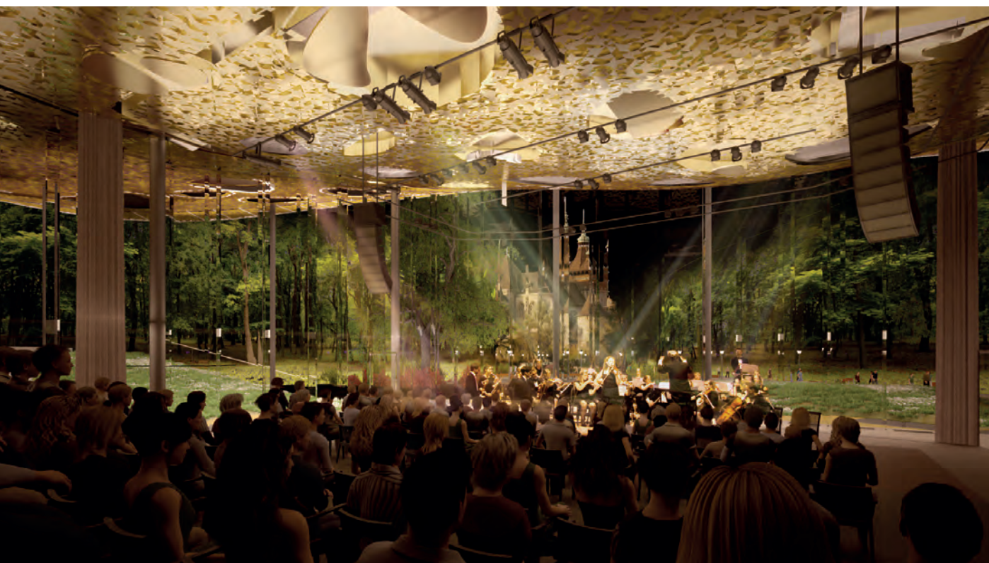
Az alapgesztus: nyitottság – a „kint” és a „bent” egysége

A föld alatti szint harmadik élményforrása különös képződmény, egy hangdóm lesz. Az ötlet az 1970-es osakai világkiállítás egyik szenzációjából, az avantgárd zeneszerző, Karlheinz Stockhausen gömb formájú auditóriumából indul ki, ahol a gömb közepén helyet foglaló közönséget hangszórók csoportjai vették körül, és az emberek gyakorlatilag benne ültek a zenében. A gömb akusztikai és technikai feltételeire több zeneszerző komponált