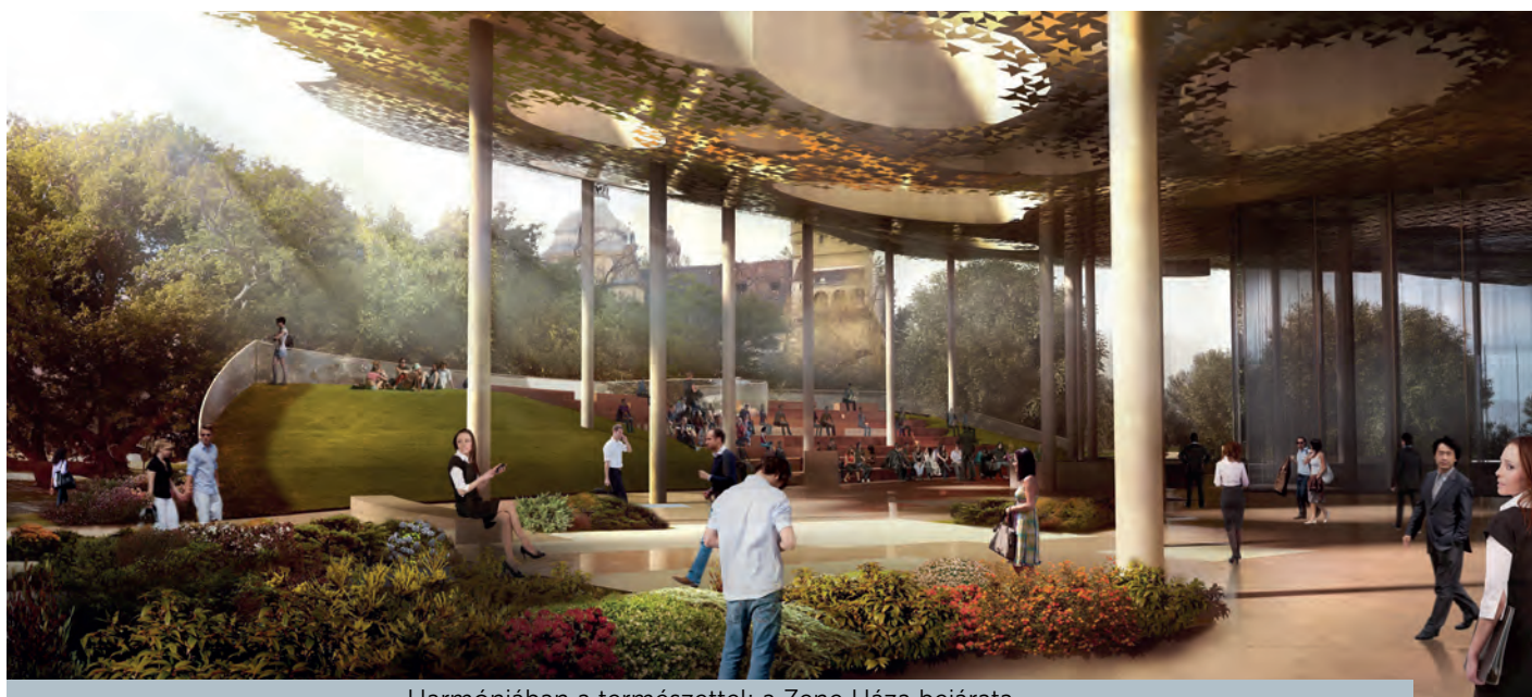
Harmóniában a természettel: a Zene Háza bejárata

Miről is van szó? A Zeneház háromrétegű, zenei nyelven mondhatjuk azt is: három fő szolam helyezkedik el egymáson. A földszint a vonás tere. Az előtér és a két kis hangversenyterem a benne zajló zenei történésekkel teszi kíváncsivá azokat is, akik nem céltudatosan jönnek zenét hallgatni. Hangverseny helyett inkább úgy fogalmazhatunk, hogy ezekben a terekben közösségi élmény jön létre, a zene beszél – hangokkal és a szavak segítségével egyaránt. A muzikusok megszólítják a közönséget, amely maga is gyakran aktív szerepet kap a zenélés folyamatában.