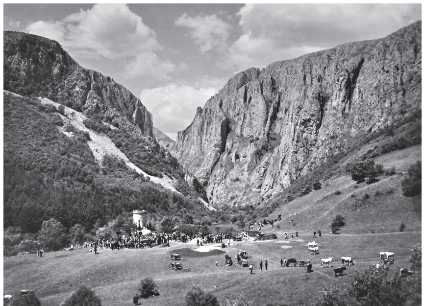
Egyik kedvenc kutatási terepe, a Tordai-hasadék

jára, sántikálva csodálta meg a Dolomitok és az Alpok sziklabirodalmát, de a terepi tájkozódásról nem mondott le. Nem kívánt tétlen hadirokkantként élni; dolgozni, tanítani, kutatni akart, bár ez sokkal több erőfeszítésébe került, mint egészséges pályatársainak. Előfordult, hogy könnyes szemmel kinlódta-kúsza végig a Révi-barlang járatait. Katonai betegszabadsága alatt tette le a pedagógiai szakvizsgát és megszerezte a tanári oklevelet. A kórházi betegágyon, szenvedések közepette jegyezte el magát a tanári munkával.