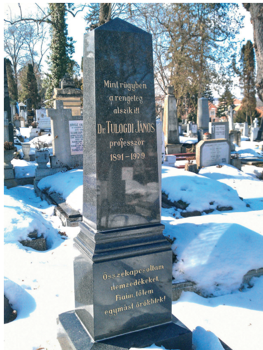
Síremléke a kolozsvári Házsongárdi temetőben

A hidrológia, a klimatológia, a természeti földrajz mellett az emberföldrajzot, a földrajzi felfedezések történetét és a kontinensek földrajzát is oktatta, de kedvenc tárgya Erdély földrajza volt. Sokat foglalkozott a Sebes-Körös Vársonkolyos és Rév közötti szurdokvölgyével.