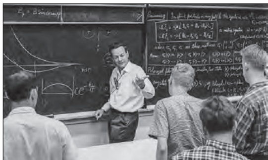
Feynman kvantummechanikát magyaráz

vedni kell, szenvedni, mindig szenvedni.” (Ugye világos, hogy Tolsztoj-imádó börtönőrrel van szó?). Michail szeretné megérteni szenvedései értelmét, szeretne találni valakit, aki felvilágosítja egy mögöttes misztikus cél létéről. Ám a buddhista lámák és a katolikus hittérítők egyként azt sugallják, hogy mindezt csak maga találhatja meg.