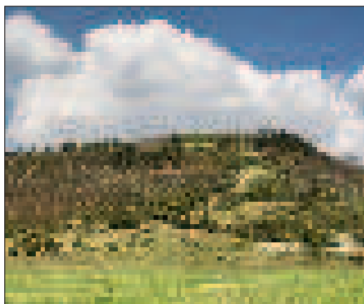
A Buda-hegy Sámsonháza mellett

Mészkövet a bányához közeli területen, például a fertődi kastélynál. A kőfejtő virágkora a XIX. században volt, az innen kinyert mészkőből épült fel számos soproni és bécsi épület.