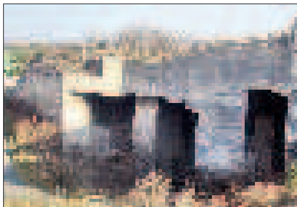
A fertőrákosi Püspöki-kőfejtő látványos oszlopcsarnoka

túlnyomó többsége mészvázú volt: a kőzetben rendkívül elterjedt a karfiolszerű vörösalsa, az úgynevezett Lithothamnium;