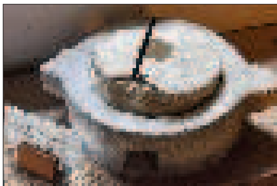
Kézi malom a visegrádi várból

Ha pedig valaki a civilizációtól távoli lelőhelyet keres, annak a Sámsonháza és Márkháza között körülbelül félúton található Buda-hegy és a déli-délnyugati oldalában található Buda-hegyi tanösvény a tökéletes célpont. A tanösvény 2. és 3. számú bemutatóhelyén tanulmányozhatjuk a lajtamészkövet, illetve annak két típusát. A 2. ponton az idősebb kifejlődés, a sárgásszürke meszes homok bukkan felszínre, amelyben puhatestűek, tenge-