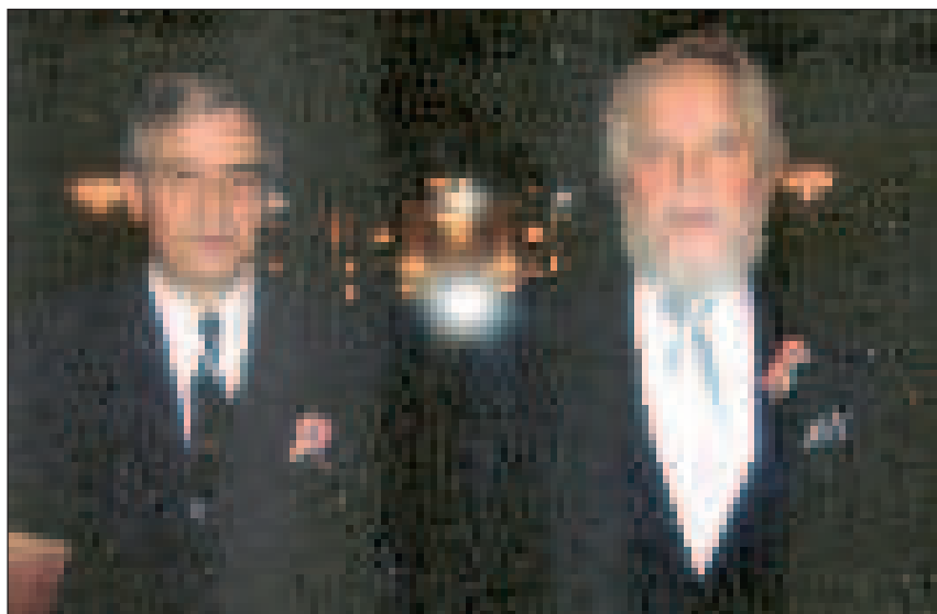
A Széchenyi-díjas Pintz János és a Magyar Érdemrend Nagyeresztve Szemerédi Endre (Parlament, 2013. március 15.)

– A számelméletben többnyire megtalálhatók, de eredeti formájukban nem mindig vezetnek eredményre azok a módszerek, amelyek másutt sikeresen alkalmazhatók. Itt van például a páratlan Goldbach-sejtés, ami azt mondja ki, hogy minden 5-nél nagyobb páratlan szám előáll három prímszám összegeként. Ez hasonlít a páros Goldbach-problémához, csak könnyebb, mert itt három szabad változónk van. Kell