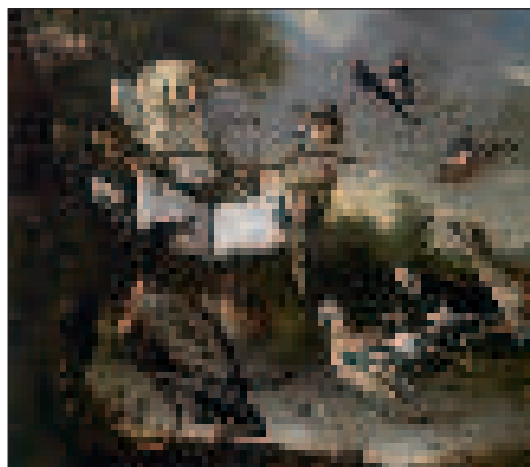
Melchior de Hondecoeter (1636 körül–1695): Madárkoncert (magántulajdon) – a számtalan variáció egyike

Talán az összes csendéletnek (vagy talán már életképeknek) tekinthető kép közül a legtöbb érdekes természeti tudósítás a baromfiudvarokból származik. Méghozzá a francia nevű Melchior d'Hondecoeter jóvoltából. (Ne feledjük, a hugenották és a Szent Bertalan éjszaka menekültjei részben Hollandiában lettek menedékre.) Ez a festő megbízható forrásnak tekinthető a XVII. századi baromfifélék genetikai változottságának felméréséhez. Képein azonban nemcsak a tenyésztett állatok, de a házkörüli vadon élő szárnyasok (néha emlősök) is megjelennek. Bíbicek, fecskék, baglyok, pólingok, godák, különféle vadréccék, héják és sasok teszik még változatosabbá a baromfi-együtteseket. Ám még ez sem elég: a festészeti kihívásnak számító pávakakasok, fácánok megjelenítésén kívül egyik-másik képen sisakos kazuár is látható (honnan más-honnan, mint Délkelet-Ázsiából) dél-amerikai gémfélék társaságában, másutt pedig pelikán és afrikai koronás daru elegyedik a tyúkok közé. A többször is megfestett (nyil-