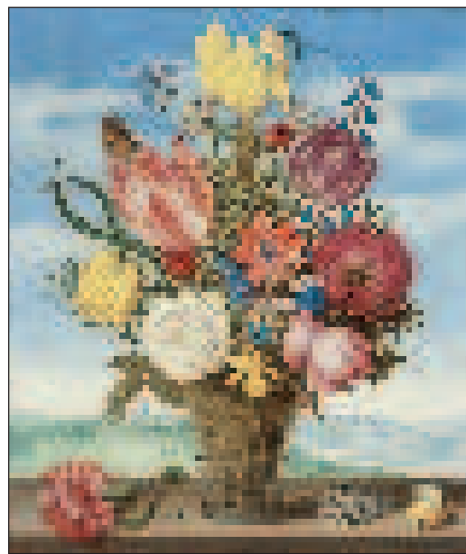
Ambrosius Bosschaert (1573–1621): Virágcsendélet az ablakpárkányon (Los Angeles County Museum of Art) – meg egy kis németalföldi tájképzéltető

Mindenekelőtt a mives üveg- vagy porcelánvázába helyezett rózsák és tulipánok. A „holland tulipán” közhelyé válását a virágcsendéletek csak megerősítették. Az egyik Bosschaert -fiú ( Johannes ) odáig merészkedett, hogy csak tulipánokat festett képére, de nem csokorba kötve, vázában, hanem meglehetősen életszerű helyzetben, a virágágyásban, ahol az egyik növény levele alatt még egy béka is meglapul. Gyíkok, pókok, rovarok egyébként szinte minden csendéleten szerepeltek. Természethű valóságukban