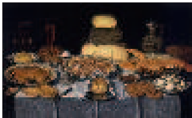
Clara Peeters (1594 körül, talán 1657): Csendélet tarisznyarákkal, garnélával és homárral (Museum of Fine Arts, Houston) – a többi ingyencsőről nem is beszélve

az említett tulipánon és rózsán kívül gyakran láthatunk íriszt, nefelejcsét, kankalint, gyöngvirágot, szegfűt, nárciszt, jácintot, haranglábát, oroszlánszájat, százsorszépét, tűzliliomot, kockás liliomot, császárkoronát, fűrtös gyöngyikét, nyári héricsét, loncvirágot, mályvát, labdarózást szőlőszemekkel, sőt bajszos zöld kukoricacsővel együtt virítani. Ezek aligha zavarták a korabeli nézőket, amint a mai nézőt sem. A legtöbben észre sem veszik a festői csalafintaságot, amiről ezáltal is kiviláglik, hogy műhelymunka eredménye. A specialisták jól ismerték és fejből idézték, vagy mintagyűjteményből másolták a képre valóság-hű vagy kitalált kedvencüket. Az igazi változás majd csak egy évszázad múlva következik be, amikor Merian asszony a tudomány alaposságával jeleníti meg hajszálpontosan természet utáni modelljeit. (De erről az illusztrátorokról szóló írásomban már beszámoltam.) A Kelt-Indiai Társaság hajósainak, utazóinak jóvoltából a virágcsendéletek gyakori szereplői a távoli déli tengerek kedvelt szuvenirjei: a tarkabarka kúpcsigák, kauri-csigák, kagylóhéjak, nautilus-házak is, melyek egyetlen korabeli polgárlakásból sem hiányozhattak. Miért maradtak volna hát le a képekről? Aki pedig szívesen feszegette a csendéletfestés határait, mint például Otto Marseus van Schrieck , kígyós-békás „erdei” csendélettel kelthetett borzongást a kép nézőjében.