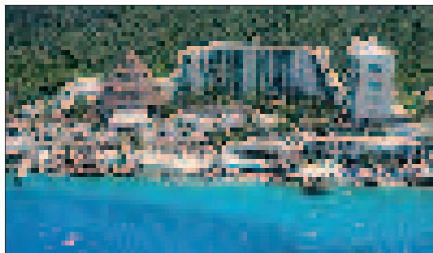
A karibi partvidék az ország legkedveltebb idegenforgalmi övezete

1511-ben Pedro de Valdivia hajótörést szenvedett és csak két hajós, Gonzalo Guerrero és Jerónimo de Aguilar menekült meg. Az előbbi feleségül vette Uaymil Chetumal kacika lányát, Nicté Hát (Májusvirág