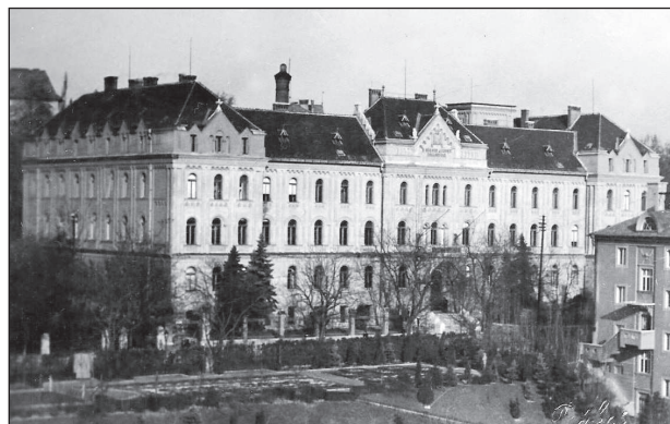
Az Eötvös Collegium Mészáros utcai székháza

A háború előtt az udvar nagyobbik, lakásunktól távolabbi részét egy hálóval körülkerített salakos tenispálya foglalta el. 1944-ben a Collegium épületébe szállásolt