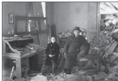
Apámmal szétlőtt irodájában 1945 márciusában

Az ebédlőből nyílt a gyerekzsoba, indián- és ólomkatona háborúk, gomb- és pöcökcsa-