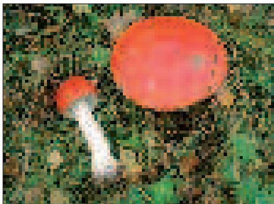
Légyölő galóca, a mesék gombája

Tízéves lehettem, amikor pár napig a vízaknai rokonságnál nyaraltam. A spaletákkal elsötétített dohos szagú szász ház emléke elevenen maradt meg bennem, de ennél jobban emlékszem egy hajnali szekerezésre, amelyet szénabegyűjtés céljából ejtettek meg, ehhez kötődik legelső gombászélményem. Serpenyő nagyságú mezei csiperkét szedhettem, amelyeket hazaérve megszórtunk és megsütöttük. Azt hiszem, hogy ez az élmény volt a szikra, amely kiváltotta bennem a gombák iránti érdeklődést, de addig, amíg amatőr gombászként odajutot-