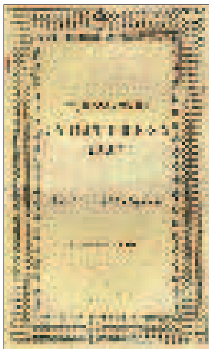
A Tudományos Gyűjtemény 1832. V. számának címlapja