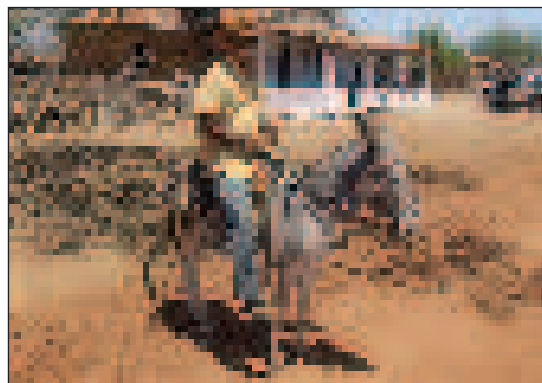
Az élet nem sokat változott errefelé a múlt század első fele óta. Autó csak a távoli nagyvárosokból tévedt ide nagy ritkán

államban történt az első jelentős összecsapás a Lampião vezette cangaçeiros , és a katonaság között. Ekkor a 60 fős betyárbanda 35 katonával vette fel a harcot, az eredmény 4 elesett katona, és 6 halott cangaçeiro . 1927. július 13-án Rio Grande de Norte állam második legnagyobb városát, Mossorót érte rablótámadás. Lampião gazdag zsákmánnyal hagyta el a várost, majd július 15-én már a Ceara állambeli Limoero do Norte, majd két nappal később, 17-én Jaguaribara városában követte el ugyanezt. Augusztus 21-én már Bahia államban garázdálkodott csapata. Az ilyen jellegű akciók nagyon sokszor megismétlődtek.