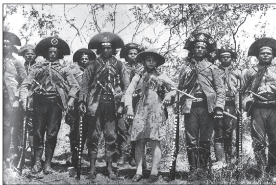
A „betyárok királya” és bandája a múlt század 30-as éveiben, tevékenységük csúcspontján. Középen Lampião, mellette Maria Bonita

1922-ben már saját bandája élén járta Északkelet-Brazíliát, és ekkortól kezdve nevezték Lampião-nak. Rengeteg akció fűződik a nevéhez, kezdetben fazendákat támadtak meg, gazdag kereskedőket, utazókat ra-