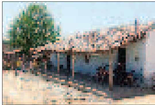
Tipikus régi fazendaépület, amely sokszor szolgált menedékhelyül a betyároknak

Lampião halálával a cangaço történetének egy szakasza végleg lezárult. A megmaradt bandákat fokozatosan felszámolták, és hosszú évtizedekre megszűnt a betyárvilág Északkelet-Braziliában. Ám napjainkban ismét megjelentek a modern kor cangaçeirói. Ebben az esztendőben június végéig csak az északkelet-brazíliai Ceará államban több mint 25 bankrablást követ-