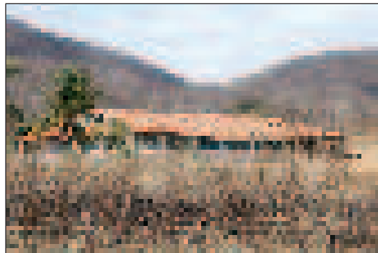
Módosabb fazenda Pernambuco államban, amelyhez hasonlóak gyakran voltak célpontjai a cangaçeíroknak

A betyárkirály tehát dicstelenül végezte be életét, de története ezzel még nem ért véget. Lampião holttestét társaival és Maria Bonitával együtt azonnal lefejezték, és a katonák a közeli Piranhas településre vitték, ahol részben megállapították személyazonosságukat, de a hivatalos eljárást csak a legközelebbi nagyvárosában, Maceioban lehetett elkezdni. (Egyes források szerint Maria Bonita és az egyik cangaçeiro ugyan halálos lövést kapott, de nem haltak meg azonnal. Őket valószínűleg még élve fejezték le.) A város a leszámolás színhelyétől több mint 100 km-nyire található, tehát a holttesteket oda kellett szállítani. A múlt század első évtizedeiben a katonák, a rendőrök a betyárokhöz hasonlóan lóháton közleked-