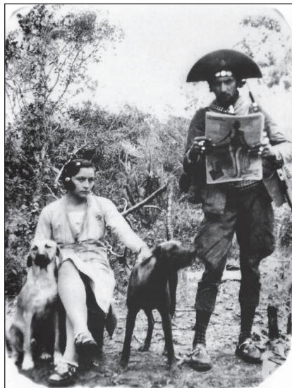
A hírhedt bandavezér, Lampião, és méltó társa, Maria Bonita

túlkapasaitól, amelyek egyáltalán nem voltak ritkák ebben a térségben. Persze ezt a hivatalos szervek is jól tudták, ezért a helyi lakosok állandóan ki voltak téve a hatóság zaklatásának. A korszakkal kapcsolatos kutatások eredményei azt bizonyítják, hogy a betyárok olykor kegyetlen és kíméletlen akciói ellenére a helyi lakosság többszörösen szenvedett a saját hivatalos szerveinek túlkapasaitól, mint a rablócsapatok akcióitól. Itt bukkannak fel először a későbbi legendák csírái. A rablóbandákat és azok vezetőit jól ismerték egész Északkelet-Brazíliában, és különösen azok körében, akiket nem érintett közvetlenül jelenlétük, illetve tevékenységük, népszerűek voltak. Ezt kihasználva, a legfelsőbb politikai vezetésben is akadt hathatós támogatójuk, hiszen ezzel elérték a szimpatizánsok rokonszenvét, illetve azok szavazatait.