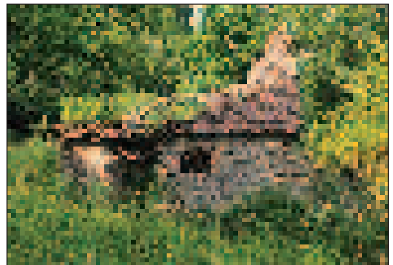
A hajdani erdészház, a Rivnyák-tanya romjai

A kilátóhely természetes sziklafalainak szomszédságában a hegygerincen találjuk az Amadé-vár alig egy-két méter magas falmaradványait. Néhány omladozó falrom és