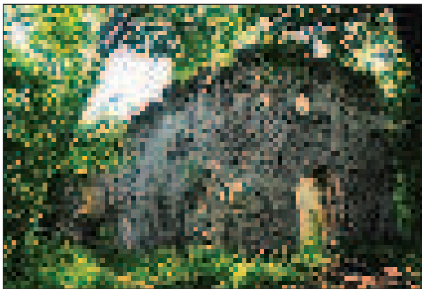
A pálos kolostor romja

A Zempléni-hegység középső tömbjének nyugati szélén hosszú, leginkább andezitből álló vonulat húzódik, amely északról dél felé haladva egyre komolyabb csúcsokkal emelkedik ki környezetéből. Az első, a Varga-hegy csak 470 méter, az utána következő Amadé-csúcs 563 méter, míg a sorban a legutolsó Téglás-kő már közelíti a 800 métert, pontosan 753 méter magas. A vonulat kelet felől igen meredek letöréssel szakad a Nagy-patak völgyébe, amely miután a Varga-hegy lábánál nyugatra, Gönc irányába fordul, északról is a hegylánc határa. A gerinc az Amadé-hegy után lapos tömbfelszínben szélesedik ki, a Téglás-kő már ennek a peremén emelkedik. Az elmúlt években egyre inkább divatba jövő Zempléni táj egyik legkevesbé járt, turistautakkal is alig érintett területe ez, amely természeti értékekben és kulturális emlékekben egyaránt rendkívül gazdag.