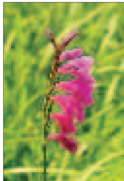
Dákoska, a kardvirág vad őse

A patak folyását követve hamarosan egy kis tisztásra, a Medvekasi rétre érkezünk. A tisztást szegélye öreg rezgőnyárok ( Populus tremula ) elszáradt gallyaiban egy másik, igen ritka védett cincérünk fejlődik, a feketemintás gesztincér ( Leioptus punctulatus ). Ugyancsak a rezgőnyár a tápnövénye egy egyre ritkuló szépséges nappali lepkénk hernyójának, a nagy nyárfalepkének ( Limenitis populi is ). A kifejlett lepkéket a napsütéses, ám nedves utak mentén találjuk meg, szívesen szívogatnak állati ürüléken. Egy másik különlegesség a vörös rókalepke ( Nymphalis xantomelas ). Soha nem volt gyakori hazánkban, a 60-as években azonban teljesen eltűnt, az ezredforduló tájékán azonban újra megjelent és egyre több helyen bukkan fel hazánkban. Életmódja érdekes, nyár elején kel ki az új generáció, amely azonban mintegy két hét elteltével eltűnik, odvas fákban, kéreg alatt egészen jövő tavaszig (!) „áttelel”. Ekkor hagyja el újra szálláshelyét, újra találkozhatunk vele, majd elpusztul. (Magam idén nyáron, rekkenő hőségben, egy odvas öreg tölgyfában hat szorosan egymás