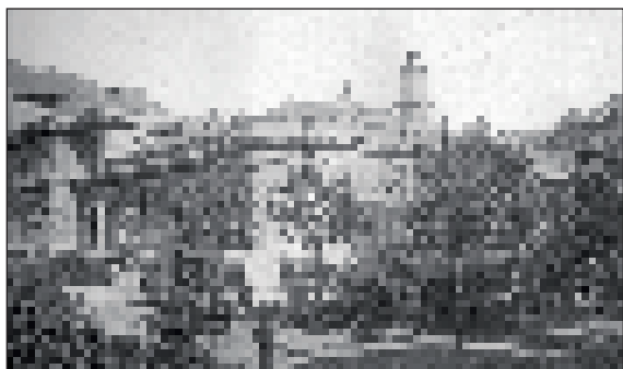
A II. sz. Szülészeti Klinika egyik lebontott épülete

Senki nem gondolt gyors sikerre, hiszen ilyen részletes tervet már egyszer (1858-ban) a Helytartótanács elé is terjesztettek, de pénzühiány miatt erre nem kerülhetett sor. Az új Orvosi Kart ekkor még a Duna-partra tervezték a Sóház és a dohányraktárak helyére, valahová a Közgazdaságtudományi Egyetem