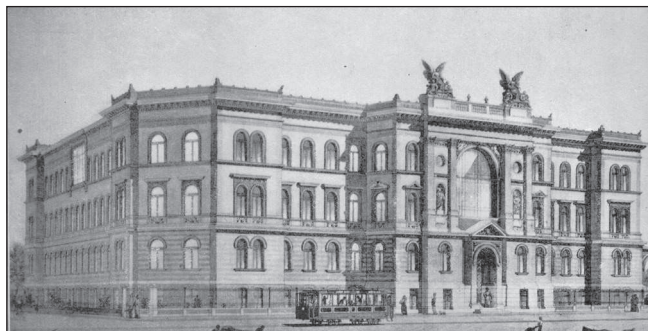
Az I. sz. Szülészeti Klinika régi épülete a Baross utca és Mária utca sarkán

Intézetnek a felépítése is. Szükség lett „felsőbb segítségre” is: az Orvosi Kar