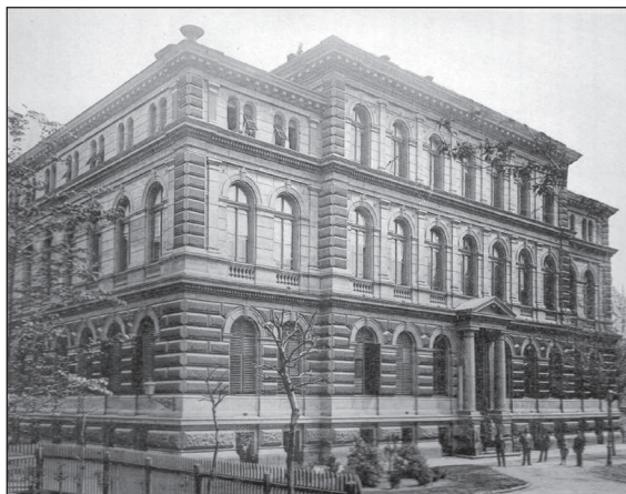
Az Üllői úti klinikai telepen az Élettani Intézet épülete

Addig kereskedelmi irodák, lapszerkesztőségek és nagyméretű bérlakások céljaira használták, de bérelt itt irodát több tudományos egyesület is.