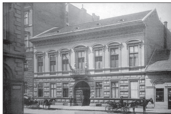
A régi I. sz. Szülészeti Klinika helyén emelt új épület