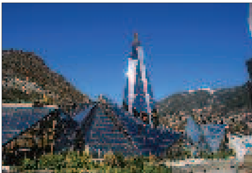
Caldea ultramodern termálfürdője

Encamp (10 ezer lakos) legelőin szarvasmarhák és juhok legelnek. A városka bőr- és kézműipari termékek központja. Errefelé találjuk a legtöbb menedékházat. Az 1980-as években épült fel a kirándulóknak a 26 tagból álló menedékház hálózat. Pásztoroknyókra emlékeztetnek, s a többségükben nincs személyzet, de az arra járók használhatják. A helyi kormány diákokat foglalkoztat azért,