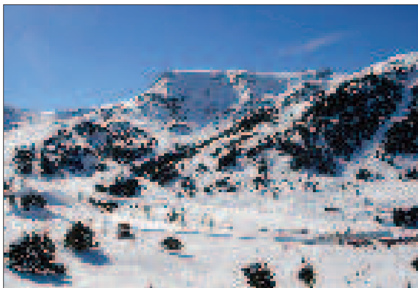
Andorrában kitűnő síterepek is vannak

Nem szabad kihagyni a bordék ban kínált andorrai konyha különlegességeit. A helyi konyhára erőteljes hatással volt a spa-