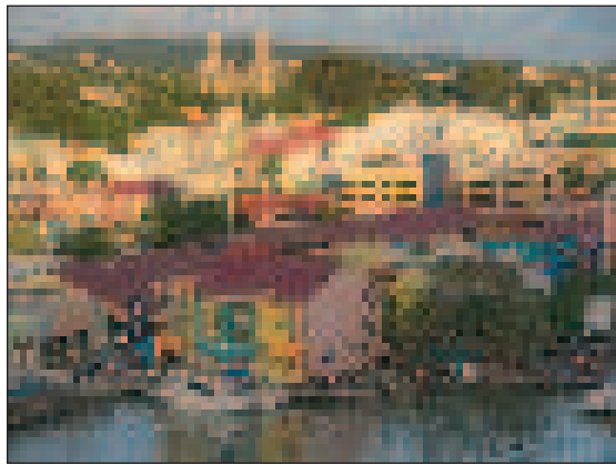
St. John's, a főváros

Antiguának nincs kitermelhető ásványkincse. Szerény ipara ellenére a térségben kimagaslók: Nagy-Britanniából érkező alkatrészekből gépkocsit és villamos berendezéseket szerelnek össze. Kicsi kőolaj-finomítója elsősorban a belső igények kielégítésére szolgál, az ültetvényes gazdálkodás maradékából cukor- és rumgyártás (a leghíresebb a Cavalier), valamint a gyapotfeldolgozás (textil- és ruhaipar) érdemel említést. Mezőgazdasága önellátásra és trópusi gyü-