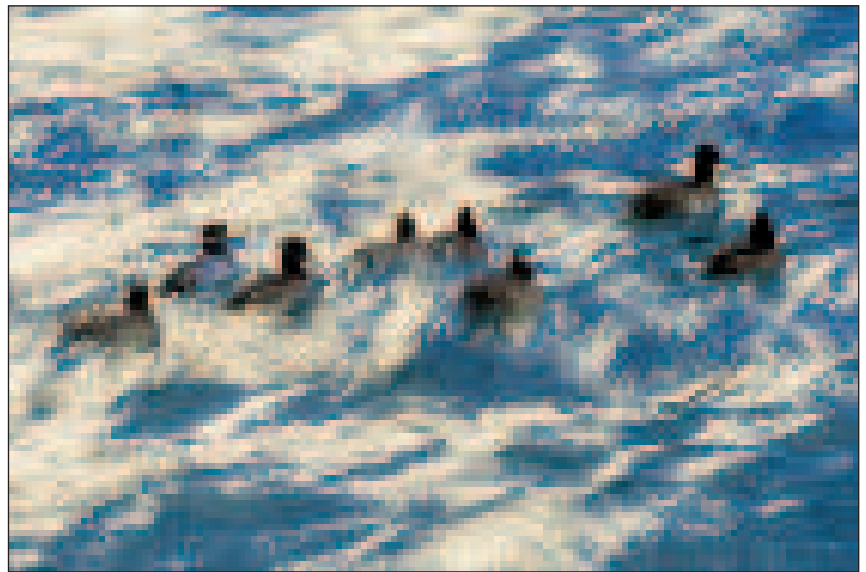
Kerekes M. István: Festmény kontyos récékkel

Nem állt szándékomban kölcsönvenni Muszorgszkij örökbecsű zenedarabjának címét, de a GDF SUEZ – Az Év Természetfotója 2013 pályázat képeinek láttán azonnal ez a zenemű jutott az eszembe. A Magyar Természetfotósok Szövetsége (naturArt), folytatva a hagyományokat, 21. alkalommal is megrendezte Magyarország legnagyobb természetfotós seregszemléjét. Igaz, ehhez az idén is sok támogatóra volt szükség.