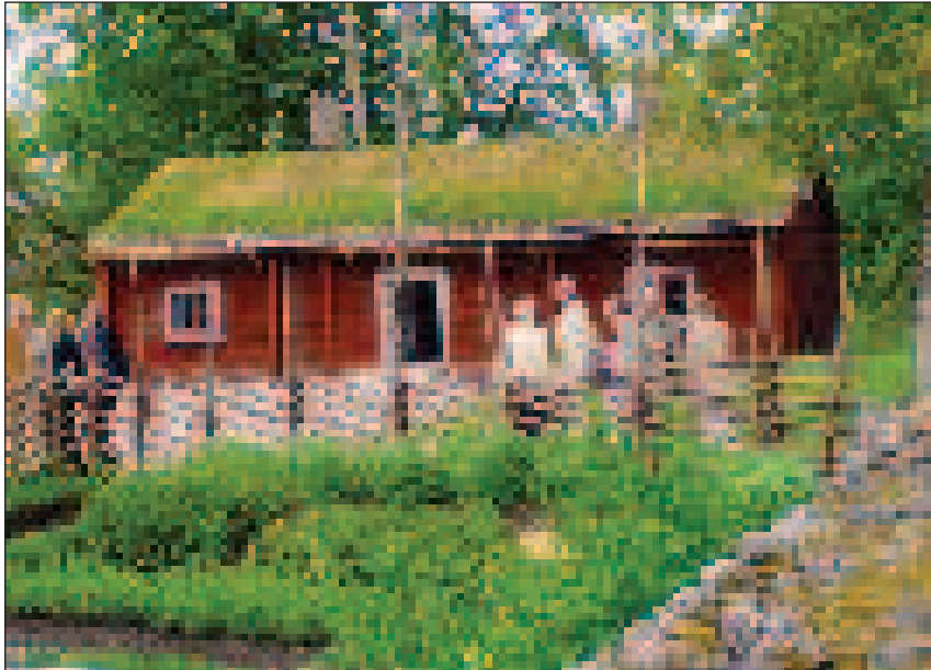
Linné szülőháza Råshultban ma múzeum