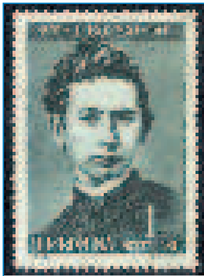
A Magyar Posta és a Román Posta bélyegei

De olvassuk tovább Morvay visszaemlékezését! „Ettől kezdve a Bolyai-kép problémája nem hagyott nyugodni, s ha nagyobb megszakításokkal is, de állandóan igyekeztem megismerni az idevonatkozó irodalmat, elolvas-