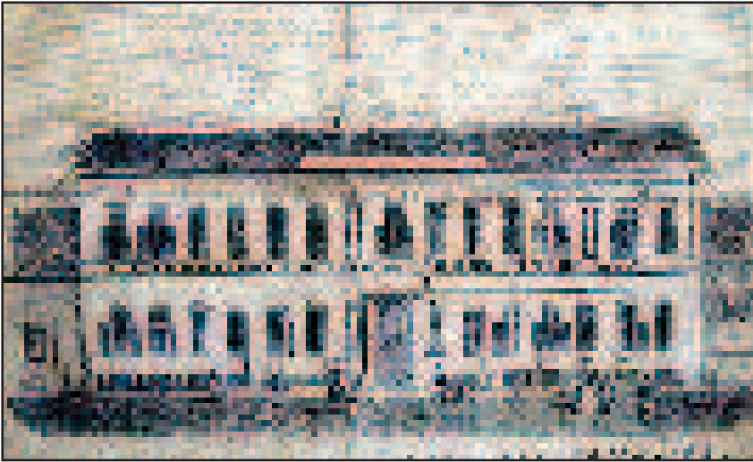
A Pesti Szegénygyermek-kórház (korabeli metszet)

hes léget lehelé, tökéletes tompa érzéketlenség jeleit nyilvánítá, főképp az által, hogy egyszerre feje mintegy lerogyott. A kisded szabadon senki által sem tartatva feküdt a műtőasztalon, számos nézőktől kömyezve, kik feszült szemekkel várták az eredményt. Ekkor a fehér izzóvasat hathatósan alkalmazván czombize fölött. Senki közülünk azon éles fájdalom alatt csak egy izommozgást sem látott rajta. Tüstént jeges borogatások alkalmaztattak. 3 percz után magához kezdett térni, de csak 6 percz után nyéré vissza tökéletes eszméletét. Ekkor már ágyába vissza volt helyezve...” Ezután már rendszeresen alkalmazta a bódítást, bár a Pesti Hírlap 1848. február 8-i számában felhívta a figyelmet a nem szakember által végzett altatás veszélyére.