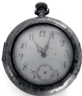
Dékány Balázs órája