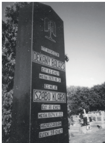
Dékány Balázs sírja a hetényi temetőben