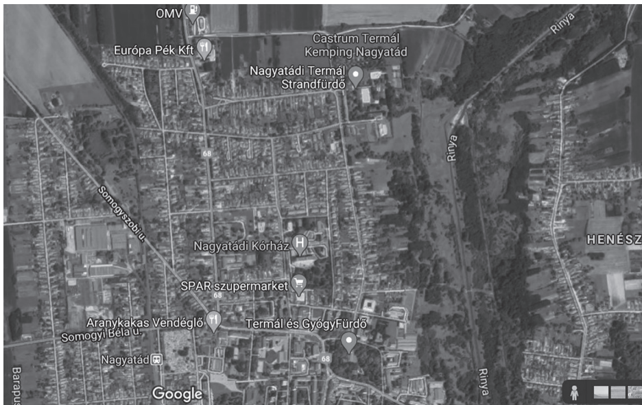
1. ábra: A legfőbb turisztikai vonzerőt képező fürdők elhelyezkedése

Nagyatád meghatározó turisztikai erőforrása minősített gyógyvize: a Nagyatádi Termál és Gyógyfürdő a térség egyik legjelentősebb attrakciója, emellett a városközponttól némileg távolabb elhelyezkedő Termál Strandfürdő. A legfőbb turisztikai attrakciók vonzerejét némileg csökkenti, hogy a két fürdő egymástól viszonylag távol helyezkedik el, illetve hogy a strand nem rendelkezik fedett wellness-részleggel, ami csak szezonális működést tesz neki lehetővé. (1. ábra)