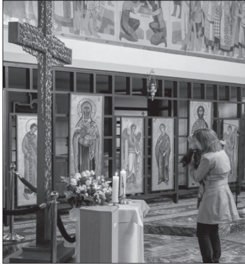
Osztvári Csaba (1963–2009): Missziós „Vándorkereszt” (2007), az 52. Nemzetközi Eucharisztikus Kongresszus magyar szimbóluma. „Minden forrásom belőled fakad” Budapest (2021. szeptember 5–12.)