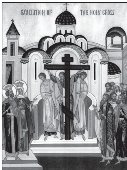
3. kép. A Szent Kereszt visszavétele a perzsáktól a VI. században. Középen Herakleitosz, bizánci császár, jobbra Konstantin és Heléna (IV. sz.)

Nekünk, magyaroknak is jutott a szent kereszt ereklyéből, amit a NEK szimbólumát jelentő missziós (vándor) keresztben láthattunk az előkészületek során, és látni fogunk majd a rendezvény ideje alatt is. A feszület két szára találkozási pontján az Üdvözítő eredeti csodatévő keresztjének egy darabja található. Az ereklyetartó hasonlít