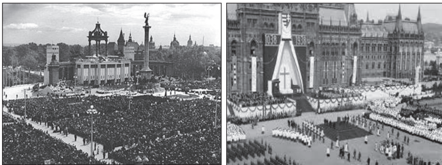
1. kép. A 34., első magyar Eucharisztikus Világkongresszus 1938. május 25–29. helyszínei. Budapest

Több történelmi tény alátámasztja a Krisztussal való idézett bánásmódot. Az első (1875) francia kezdeményezést a nemzeti eucharisztikus kongresszus folytatását a Harmadik Köztársaság egyházellenes intézkedéseivel megakadályozta. Hamar sutba dobták a forradalom: szabadság, egyenlőség, testvériség liberális eszméit. Ezt követően a világ minden táján, Amerikától – Dél-Amerikán – Ausztrálián – Európán át Ázsiáig tartottak 1881-től nemzetközi kongresszusokat.