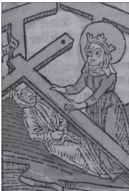
2. kép. A Szent Kereszt felmagasztalása – szept. 14. Legenda Aurea Sanctórum ősnymtatvány, 1482, Pannonhalma

( Gondolatok, tények a Szent Keresztről ) Megváltónk szenvedéstörténetének, megdicsőülésének evangéliumi leírataiban pontosan követhető a nagypénteki tragédia minden fontos mozzanata. A keresztre feszítéstől, a kínhalálon át egészen a feltámadásig. Érdemes tehát megismerni a Szent Kereszt rövid történetét, és ökumenikus hatását.