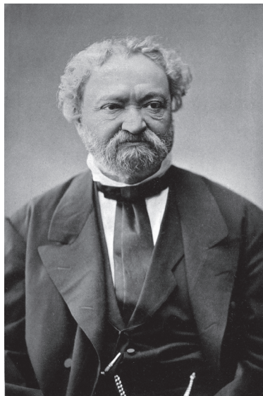
Erkel Ferenc az 1880-as években.

Erkelék önjelölt támogatói 1889 nyarán revánsot vettek az elvesztett pozíciók miatt, és az Országos Dalárszövetség szegedi ünnepén – a nagyszerű hangversenyek közepette tartott közgyűlésen – egy jól szervezett kisebbség leváltotta a szövetség szinte teljes korábbi vezetését. Szentirmay Elemér alelnök és Ságh József titkár helyére más került, az előző napokban még ünnepelt és ovációkkal fogadott országos karmagy, Hubay Jenő helyett –