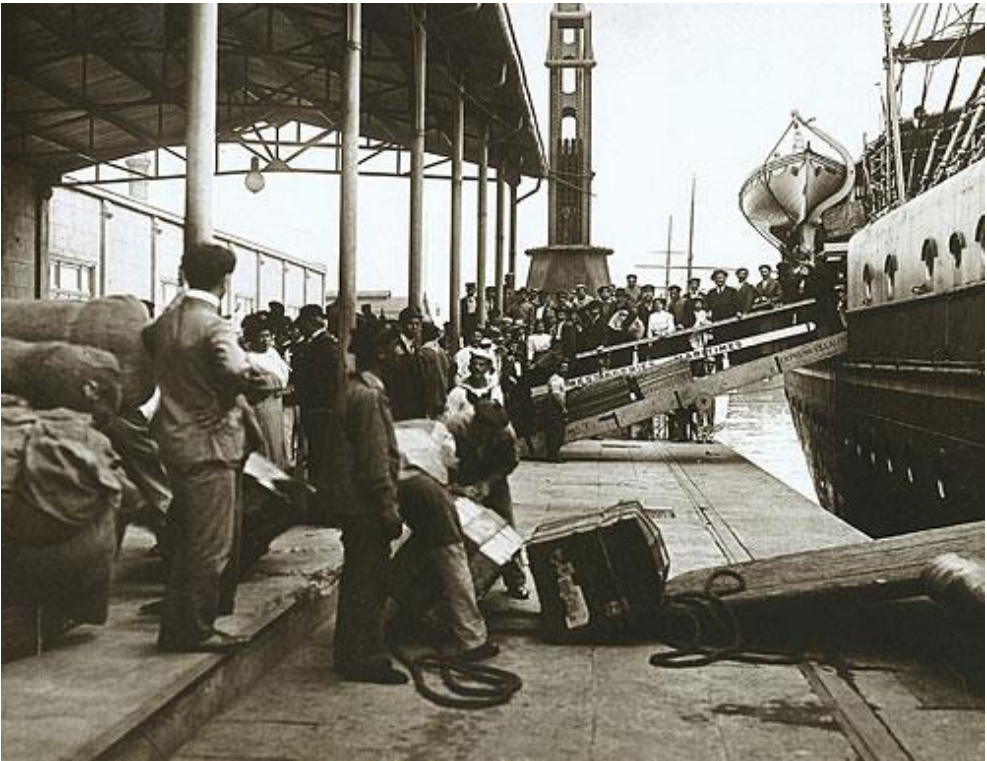
3. számú ábra. Bevándorlók érkeznek az (argentín) új hazába.