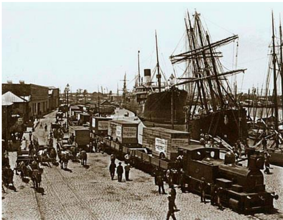
2. számú ábra. Argentín kikötő a huszadik század elején. Vitorlások és kereskedelmi gőzösök, iparvágánnyal a vagonok és kezdetleges „Ro-Ro szállítás”

latin-amerikai országot. A kor színvonalán a legkorszerűbb kereskedelmi hajók és hozzájuk szükséges kikötői infrastruktúra jelenik meg La Boca-ban. A fő kiviteli cikket, a marhahúst az 1870-es évektől már nemcsak mint élőállatot, hanem mirelitként! is behajózhatták a Buenos Aires-i kikötőben. Ehhez a kort megelőzve az akkori legkorszerűbb technikákat felhasználva hűtőházakat és hűtőhajókat vonnak be a szállításba. Ennek köszönhetően a fagyasztott hús kivitelének mennyisége közel tízszeresére nőtt 1910-re. 7