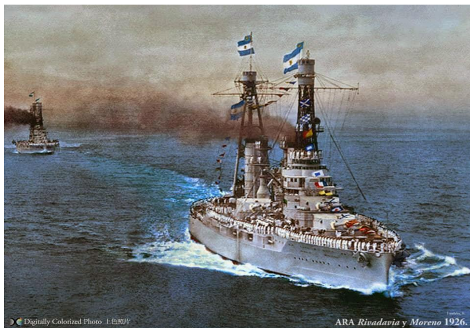
7. számú ábra. Az Argentin Armada csatahajói fénykorukban (1926-ban)

A fejlesztés azonban nem állt meg a csatahajóknál, egy sor kisebb és korszerű hadihajó és idővel tengeralattjárók is megjelentek a haditengerészet kötelékében. A „búvárhajók” rendszeresítésének szándéka már korábban felmerült a döntéshozók fejében, ennek ellenére a