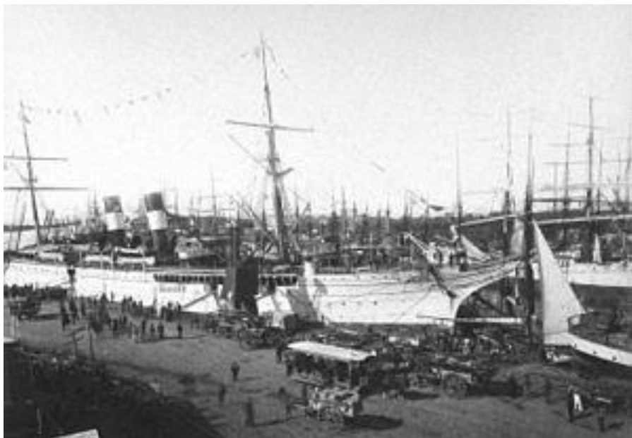
1. számú ábra. A La Boca kikötő egyik mólója a XIX. század második felében. A képen rakodó vitorlás gőzhajók.

Argentína első elnöke Bernardino Rivadavia és az általa vezetett junta protekcionista politikát hirdetett. Előrelátóan a világ akkori első számú tengeri és gazdasági hatalmával, Nagy-Britanniával veszik fel a kereskedelmi kapcsolatokat, amely a partnerségért cserébe rengeteget investált a térségbe. Többek között kiépítik a Buenos Aires kikötőt; ennek központja a La Boca városrész, mely a mai napig magán viseli a bevándorlók által hozott heterogén etnikai viszonyokat. A XIX. századtól kezdve főleg olaszok költöznek be, ezért a kikötőkben dolgozó munkások és tengerészek egy része is közülük kerül ki. 4