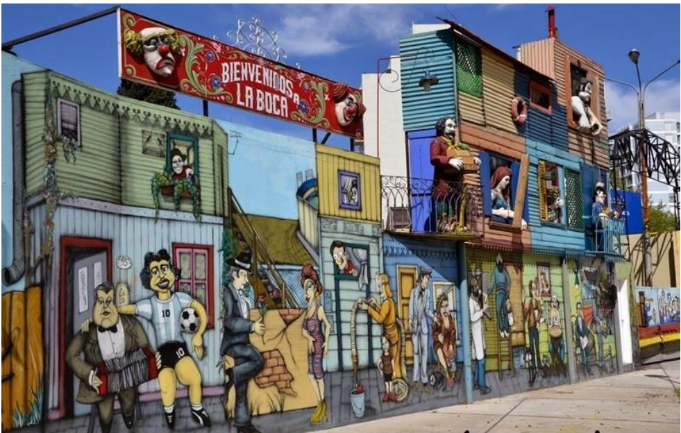
4. számú ábra. Buenos Aires kikötőnegyedének, La Boca-nak egy tipikus utcája