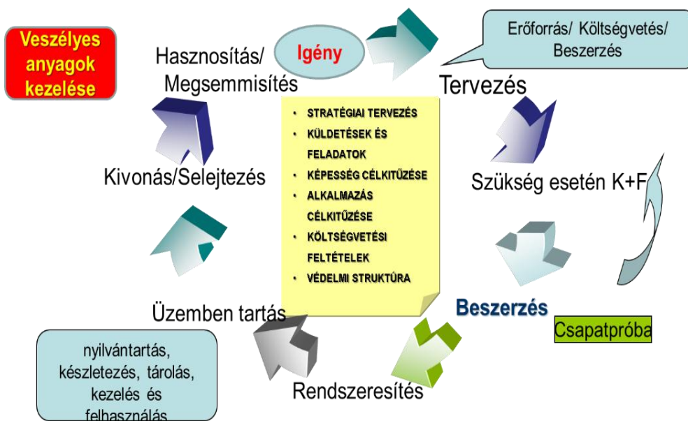
2. számú ábra. Hivatásrendek logisztikai gazdálkodásának folyamata (Derzsényi Attila saját készítésű ábrája)

A fentiek alapján megállapítható, hogy a logisztikai gazdálkodás tervezése, szervezése és végrehajtása során a védekezéshez szükséges igény teljes életciklusát átfogó szemlélet, valamint az életciklus-költségszámvetés alapelvei alkalmazandók. Amennyiben a logisztikai gazdálkodás folyamatát párhuzamba állítjuk az életciklussal, akkor ezt a folyamatot gazdasági számvetések alapján elemezni is tudjuk.