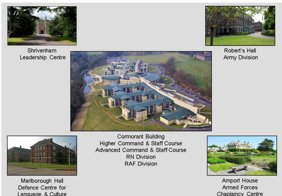
2. ábra. A brit tisztképzés szervezetei (a Védelmi Akadémia épületei)

A szakcsapatoknak általában saját kiképző ezredei vannak, mint például a Védelmi Tűzszerész Kiképző Ezred (Defence Explosive Ordnance Disposal, Munitions & Search Training Regiment), amely a Királyi Katonai Műszaki Iskola (Royal School of Military Engineering) része vagy a 25. Logisztikai Kiképző Ezred (25 Training Regiment), amely a Királyi Logisztikai Hadtesthez (Royal Logistic Corps) tartozik.