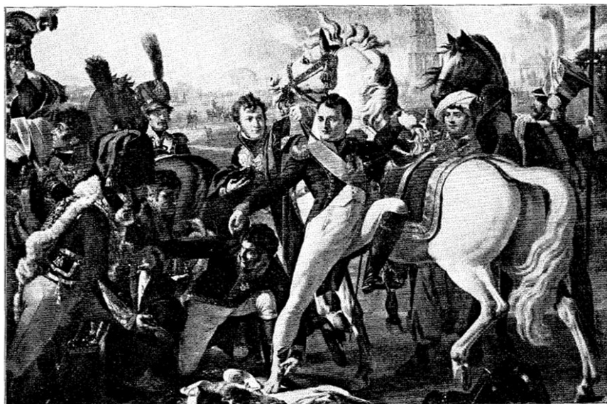
3. ábra. Napóleon megsebesülése Regensburgnál. Gautherot képe (Versaillesi múzeum) 70