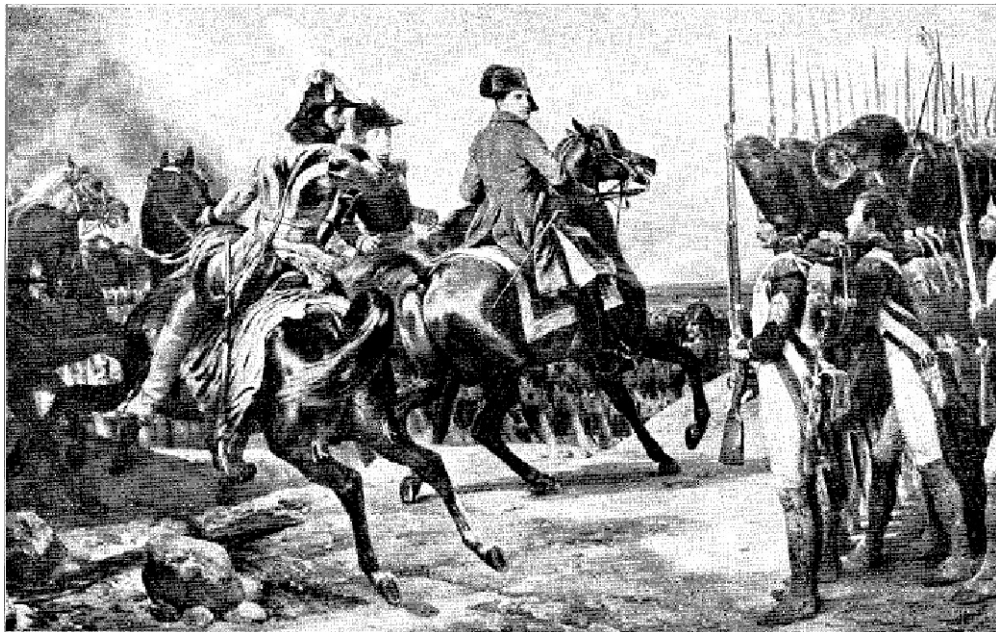
1. ábra: A jenai csata Horace Vernet képe (Versailles-i múzeum) 55

A lovas tartalékot a gyalogság hadrendje mögött – az ellenfél tüzérségétől védett helyen és távolságban – állították fel a hadrendben. Alkalmazása már felállításában sem tükrözte azt a korábbi, illetve más államok által követett gyakorlatot, amely szerint a lovasság a gyalogság szárnyain (vagy kisebb egységekben a hadrend köztes réseiben) elhelyezett támogató fegyvernem. „Napóleon (...) lovasságát ellenfeleinél jobban és megelőzőbben használta fel. A francia lovasság alatta új működési teret nyert (...) már nem úgy, mint előbb, sablonosan a csatarendek szárnyain foglaltak állást, hanem a harc- és terepviszonyokhoz képest ott helyezkedtek készenlétbe, ahol a másik két fegyvernem sikereit a lehető legjobban kiaknázhatták. ” 54 A lovasság így - a nehézlovasság szervezetfejlesztési folyamata során - elsőként a napóleoni francia haderőben vált önálló fegyvernemmé .