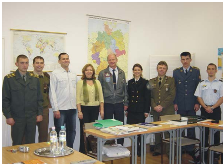
A tanfolyam résztvevőinek egy csoportja.

kintve viszont költségkímélő – hozzájárulást tennénk a NATO általános és egyéni képzési rendszerének fejlesztése terén.