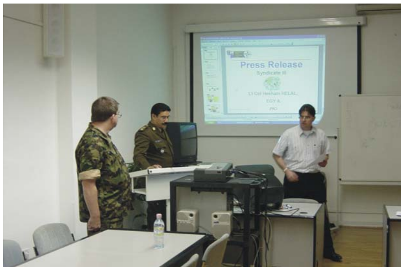
Önképzés a tanfolyamon.