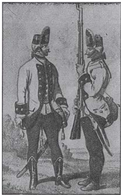
Magyar gyalogság tisztje és vitéze 1767-89.

Nagy változások történtek az egyenruhán 1767-ben.