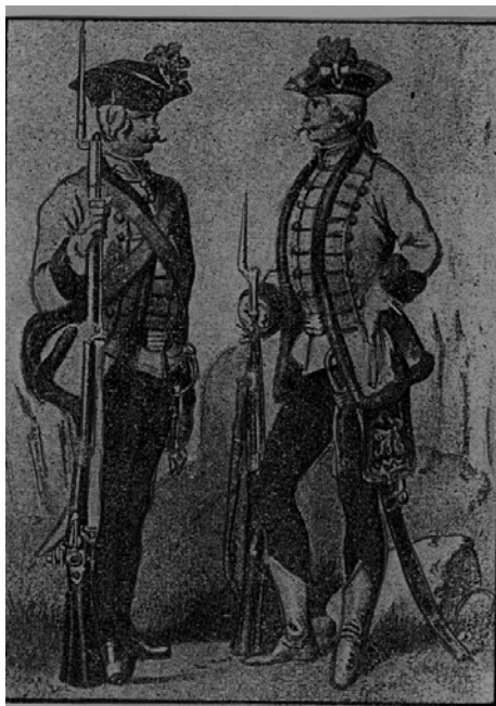
Magyar gyalogság tiszte és vitéze

A felszereléshez tartozott és egyben a tiszti és altiszti méltóság kifejezésére szolgált, a fegyelem fenntartásának egykorú eszköze: a bot. A tizedesnek egyszerű mogyoró-fapálcája volt, az őrmester pálcáját már kis szíj díszítette, a tisztek spanyolnád botot viseltek, melynek fényes gombja és arany rojtjai a rendfokozatot fejezték ki. Az őrmester botja 1798-tól szintén spanyolnád volt. A tisztek botját 1807-ben, az altisztekét 1848-ban törölték el. A legénység szolgálaton kívül a XX. században használatos könnyű sapkát viselt; mindenkinek volt bádogkulacsa; 5 emberként 1 sátor, 1 ásó vagy csákány és 1 főzőedény volt rendszeresítve, melyeket málháslovakon szállították. Az 1733-ban, illetve 1834-ben szervezett két hajdúezrednek (későbbi 34. és 19.) hasonlóan magyaros ruházata volt.