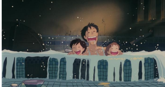
Totoro, a varázserdő titka (1988)

Összességében az ideális boldog gyermekkort ábrázolja a film: a gyerekek egészséges családban élnek – egymást és a gyermekeiket szerető szülők, akik biztosítják a lányok fizikai és lelki szükségleteit. Középszerű, de stabil körülmények között élnek, lehetőségük van az iskoláztatásra is (Győri, 2006). A két kislány csak olyan tevékenységeket végez, amit ebben az életkorban végezniük kell: rengeteget játszanak, ismerkednek a világgal, folyamatos rohanásban vannak. Miyazaki a filmben bár egy ideált fest le, mégis igen élethűen ábrázolja a kisgyermekkor életkori sajátosságait (a három film közül a legpontosabban).