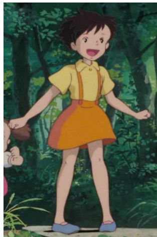
Totoro, a varázserdő titka (1988)

Satsuki számára az anyja a példaképe, tőle való visszajelzés nagyon fontos. Ezt a kórházi jelenetben ábrázolja is a szerző: édesanyja fésüli a kislányát, a kislány pedig boldogan mosolyog, hosszan lehunyja a szemét, és arca enyhe pírba borul. A megállapítást szintén a szövegkörnyezet támasztja alá.