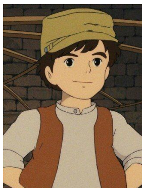
Laputa, az égi város (1986)