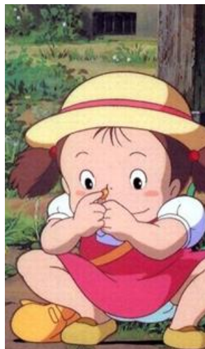
Totoro, a varázserdő titka (1988)

A mese legkisebb gyermekszereplője a négyéves kislány, Mei. Miyazaki a kislányt mind külsőleg, mind belsőleg tökéletesen olyannak ábrázolta, amilyen valójában egy négyéves szokott lenni: arca még olyan, mint a babáké: pufók és széles, világosbarna haja két oldalt két copfba van kötve, amiből azonban kicsúszik a még szállongó babahaj. Testalkata még aránytalan, végtagjai tömzsik, rövid. Egyszerű, gyorsan fel- és levethető piros (mely szín a távol-keleti kultúrákban az öröm jelképe) ruháskája van, alatta egy buggyos ujjú, galléros fehér pólóval (Pál és Újvári, 2001). Ruhája alól kilóg a fehér, hatalmas fehérneműje, mely a nézőt akaratlanul pelenkára emlékezteti, így a gyermek