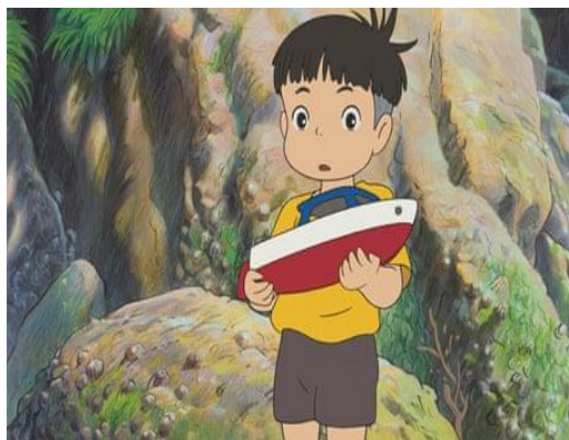
Ponyo, a tengerparti sziklán (2008)