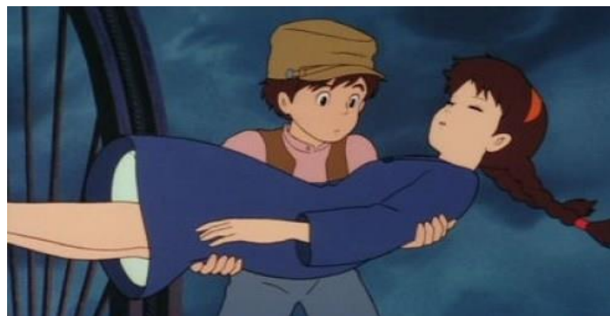
Laputa az égi város (1986)

Sheeta szintén 10-12 éves kislány. Nőies testalkata arra enged következtetni, hogy akár idősebb is lehet, 13-14 éves. A mesében háromféle ruhában ábrázolja a rendező, ezek közül az első egy háromnegyedes ujjú, térd alá érő kék ruha; a második egy hosszú fehér hálóing, a harmadik pedig egy buggyos sárga felső és buggyos piros nadrág.