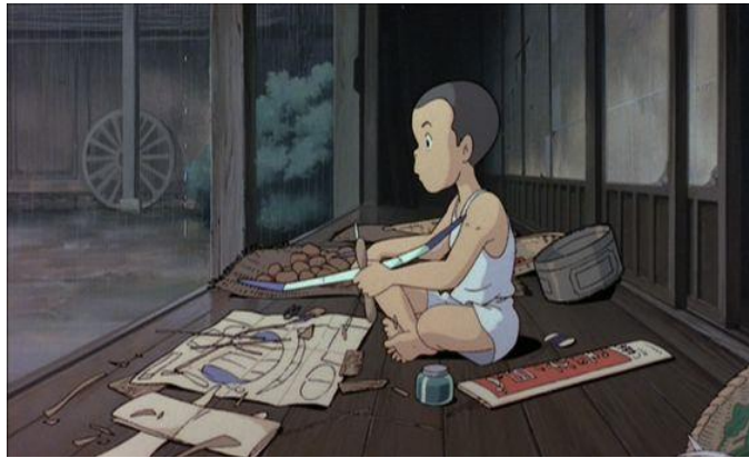
Totoro, a varázserdő titka (1988)