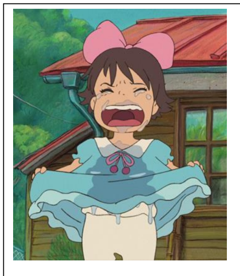
Ponyo, a tengerparti sziklán (2008)