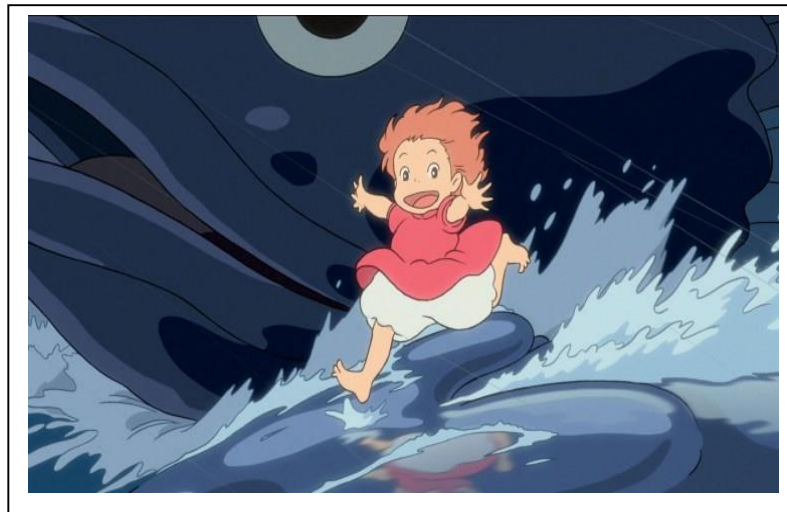
Ponyo, a tengerparti sziklán (2008)

Ponyo szintén egy óvodáskorú, öt éves kislány, aki aranyhalból válik kisgyermekké. Hal formájából sokat megőriz gyermekként: rövid piros ruháskája van, ami alól kibújik a fehér bugyogószerű alsónemű. Kócos vörös fürtjei a válláig érnek, amik szinte mindig úgy lebegnek az arca körül, mintha még mindig a vízben úszna, élénk, kíváncsi és szabad természetére utalva. A hal elsődlegesen termékenység szimbólum, illetve az alvilághoz is kapcsolódik, mivel a tenger mélye az ember számára egy titokzatos és idegen világ, az aranyhal pedig a gazdagságra utal. A piros, illetve a vörös szín egyaránt jelképezi az életet és a halált, a nemiséget, a távol-keleti kultúrákban pedig az öröm szimbóluma (Pál és Újvári, 2001), ami kifejezetten Ponyo, és a gyermekek lételeme. Ponyo nevét Sosukétól kapta, mely